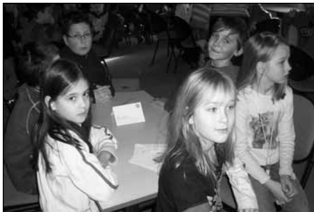
Soustředění družstva Koniků.