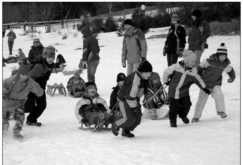
Závody psích spřežení.