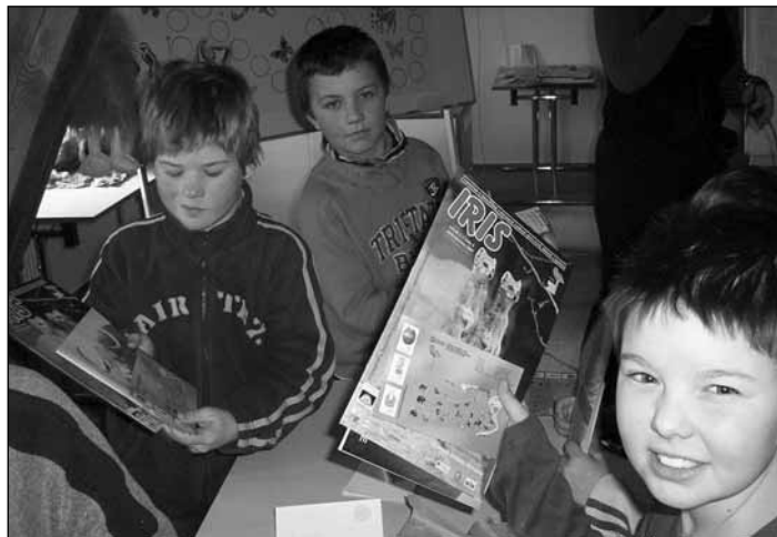
Sedlečtí supi vybalují svoji odměnu.