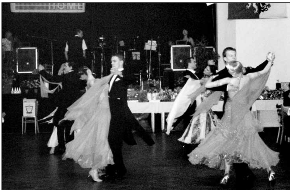
Peklo a ráj v podání taneční školy Gregoriades.

Bohemia Sekt, a.s. SHS autoopravna s.r.o. Pronap s.r.o. Kanalizace a vodovody Starý Plzeňec, a.s. Správa a údržba silnic, a.s.