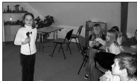
Domča jako zdatná komentátorka.

Osmý týden tohoto roku zahájili žáci 2. – 5. ročníku sedlecké základky návštěvou ZOO. Nešlo však o běžnou prohlídku, ale o soutěžní klání družstev, které se konalo na statku Laufnerka a jež si pro nás připravily pracovnice ZOO Eva a Zuzka.