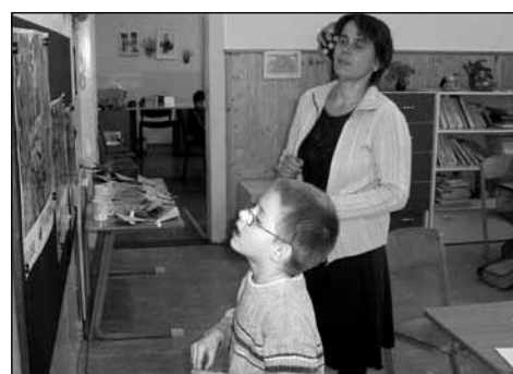
Ondra u tabule se zvířátky.