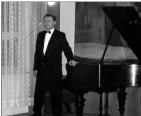
Vynikající pianista Maxim Averkiev.

Do posledního místa zaplněná obřadní síň odměnila umělce bouřlivým potleskem.