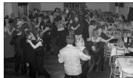
Na tanečním parketu bylo stále plno a hosté se skvěle bavili.