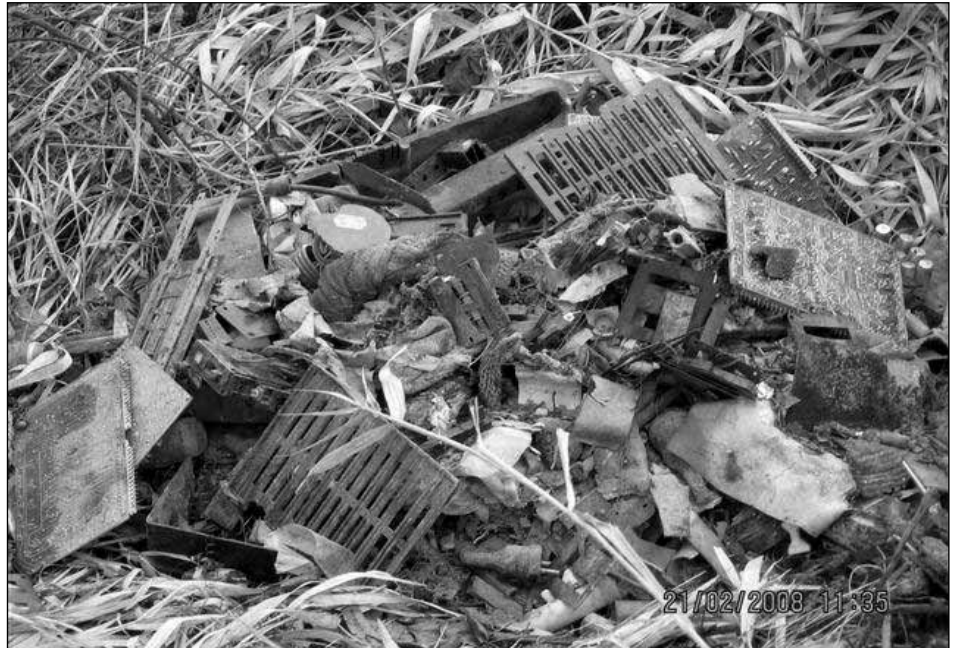
Proč jsou mezi námi stále takoví barbaři, kteří úmyslně ničí přírodu?

Helena Šašková odbor životního prostředí MěÚ