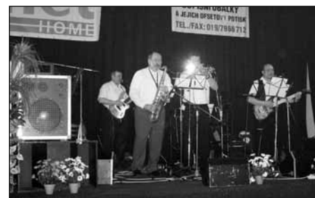
Kapela Bílá pěna hrála skvěle po celý večer k tanci i poslechu.