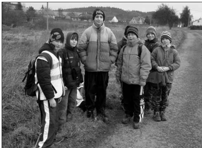
Na cestě z Nekvasov do Chlum.