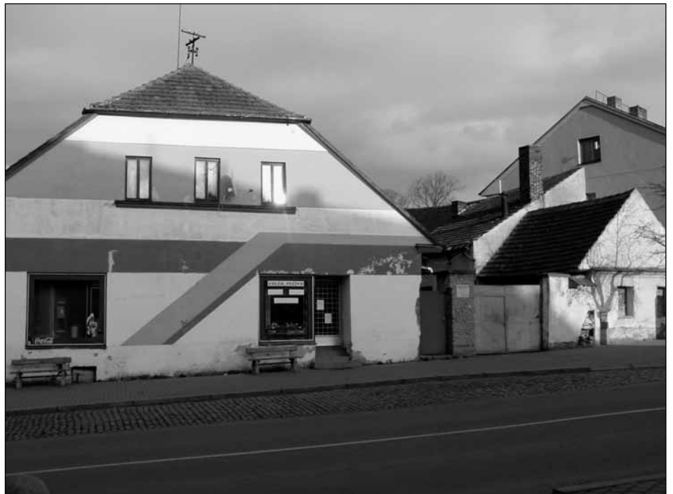
Dům, o jehož historii pojednává článek, v současné době navštěvuje takřka každý z nás, aby si zde koupil čerstvý chléb a pečivo.