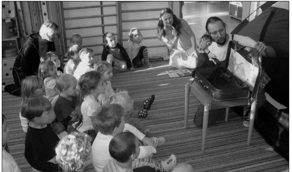
Pohádková cesta za Karkulkou začíná...