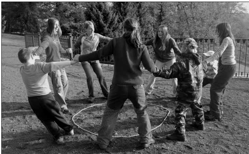
Kdo vypadne z kola ven?