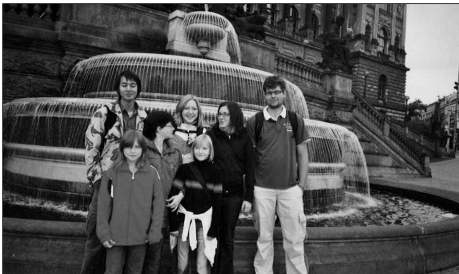
Účastníci výpravy před Národním muzeem.