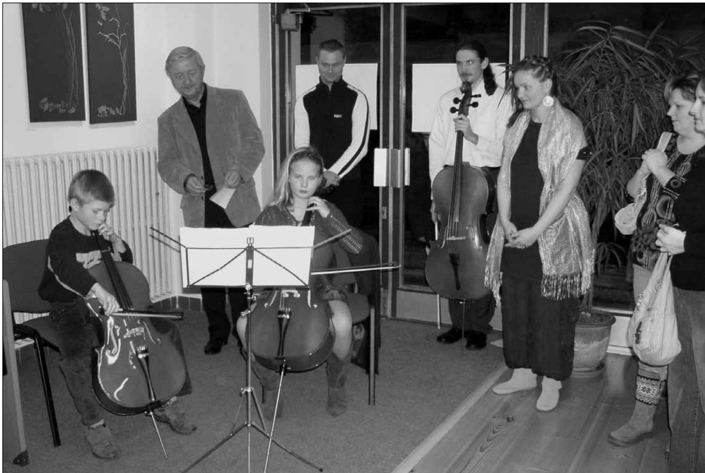
Výstavu hudebně zahájil violoncellový duet nejmladších muzikantů.