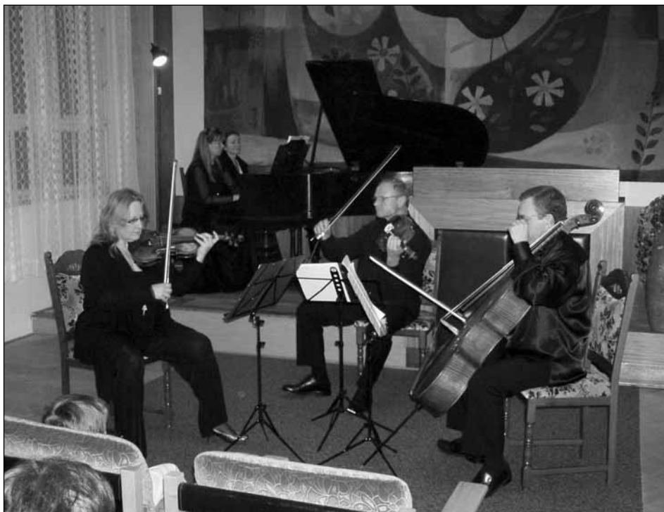
Klavírní kvarteto Ad libitum hraje – dle libosti ve Starém Plzenci.