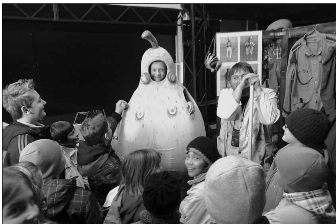
Snímek z představení Tři mušketýři.