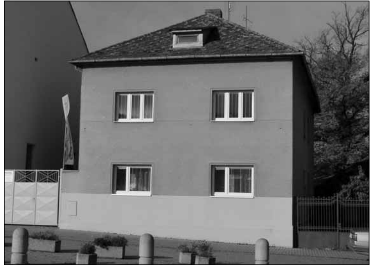
Dům č.p. 36 na Masarykově náměstí ve Starém Plzenci, o jehož historii pojednává článek.