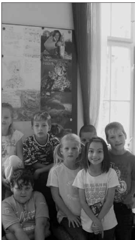
Třetáci s výsledky svých projektových prací.