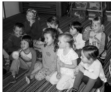
Takto se staráme o své zoubky.