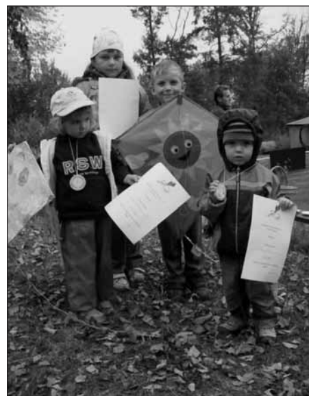
Dráčci se svými draky.