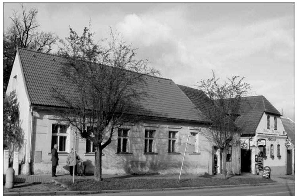
Domy zleva č.p. 35 a č.p. 34, o jejichž historii pojednává článek.

O domku č.p. 35 je ze starších záznamů známo pouze to, že v Robotním seznamu z roku 1777 je uvedeno, že zde (Pokračování na str. 5)