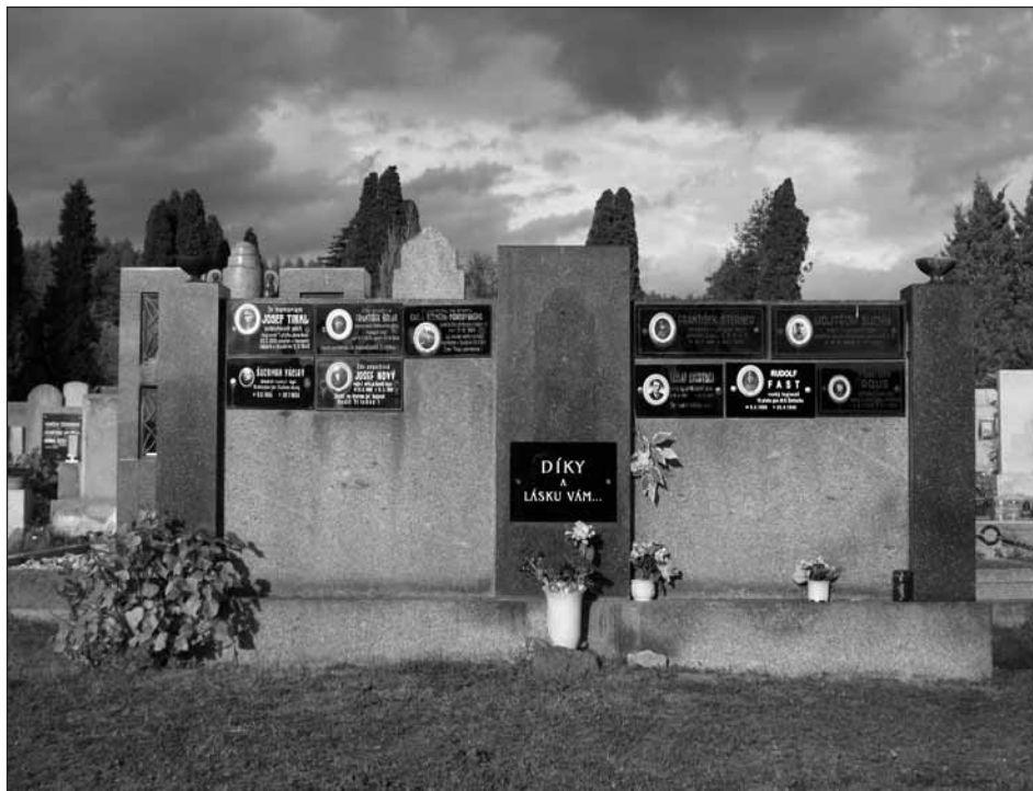
Čestné místo věčného odpočinku staroplzeneckých legionářů.

Slavíme my dnes dostatečně tento svátek? Při pohledu na sochu nás může napadnout: co by bylo, kdyby se dějiny ubíraly jinou cestou? Stačilo by například, aby velmi konzervativní císař František Josef I. zemřel tak o deset let dříve. Jeho pokrokovější následovníci by možná mohli zabránit 1. světové válce. A co poslední rakousko – uherský císař Karel se svou vizí státu jako volnější federace