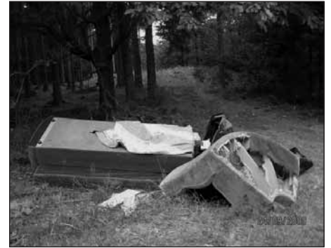
Černá skládka v lese u silnice na Radyni.

Máme možnost při lepším přístupu k životnímu prostředí, svému okolí a v zájmu města mnoho z toho napravit. Finančně také můžeme postihnout až 2 roky zpětně ty nepořádné a lhostejné.