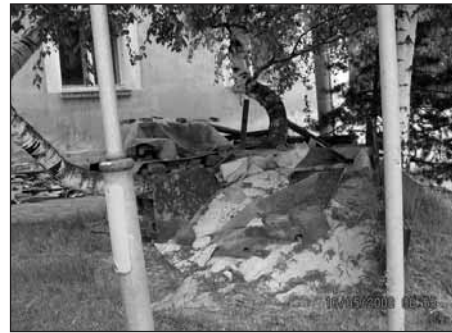
Hromada stavebního odpadu na Malé Straně.

Tyto lidi vůbec nezajímá, že již několik let je provozován sběrný dvůr v Husově ulici s dostatečně dlouhou provozní dobou tři dny v týdnu, kde lze bez problému zlikvidovat veškerý komunální a domácí