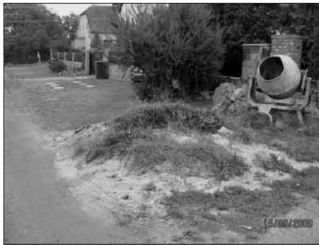
Nepořádek ve Sportovní ulici.

Stavební suť z různých úprav a oprav domů, výkopová zemina, štěrk, písek a další harampádí vyvezené před plot a tam ponechané i několik let, možná něco z toho rozhrnuté, aby to nebudilo takovou pozornost - v nejhorším případě pak navedeno do příkopů. Voda pak teče a teče nikoliv do příkopů, ale prostředkem ulice, nabírá štěrk a ten zanese vše, včetně kanalizačních sítí a dosud funkčních vodotečí. Kolotoč problémů se stále rychleji roztáčí,