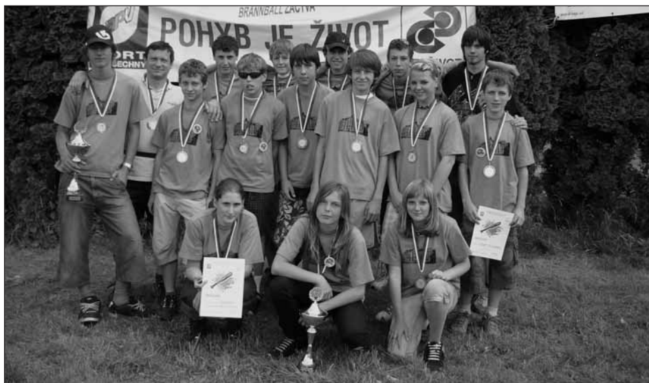
Naše úspěšné družstvo.