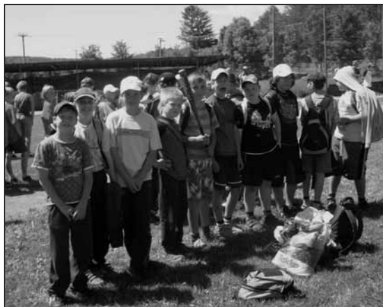
Naše družstvo T-Ballu.