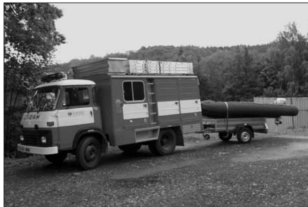
Zásahové vozidlo s člunem.

Největším nebezpečím v době sekání trávy je její ponechání posekané na místě, neboť i trochu větší dešť je schopen udělat z ní nepřekonatelnou hráz zvláště na oplocení pozemku a pak se dá těžko zabránit vyšším škodám.