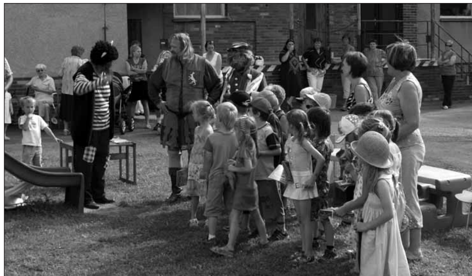
O zábavu dětí bylo jaksepatří postaráno.

Děti ze 3. třídy MŠ Starý Plzenec