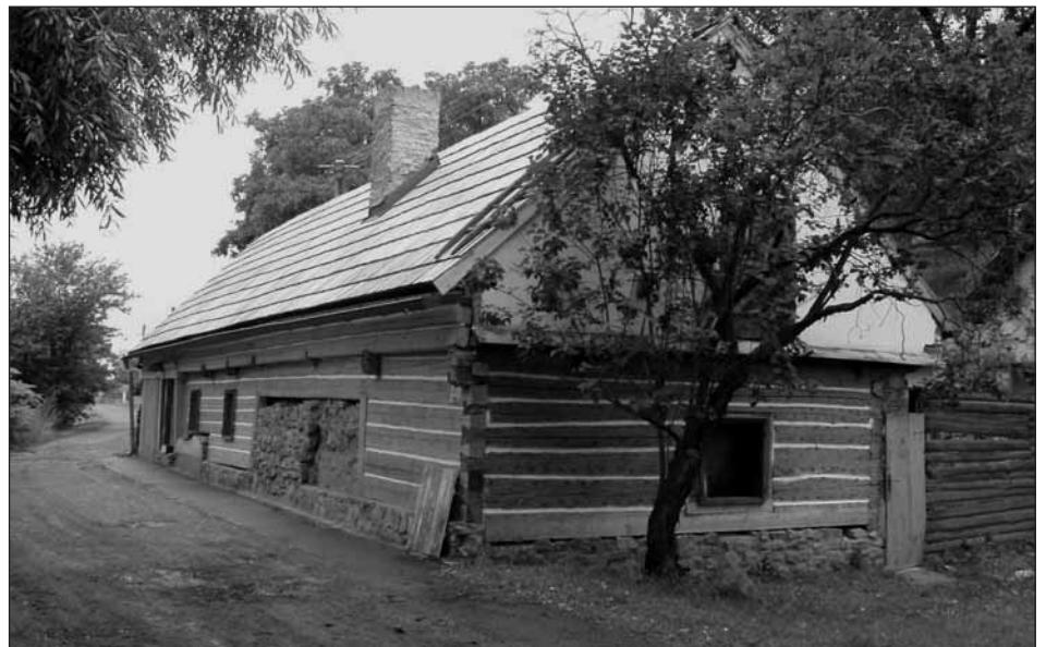
Dům č.p. 29 v Podhradní ulici, který je dle autora článku nejstarším domkem ve Starém Plzenci.