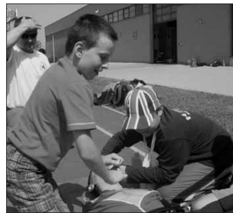
Putá při resuscitaci raněného.