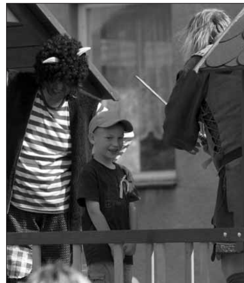
Pasování na školáky.