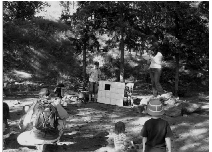
Hraná pohádka O perníkové chaloupce.

Na prázdniny máme připraven program pro všechny ty, kteří mají rádi výlety a zábavu. Pravidelně každou středu se bude konat nějaká akcička o které budete dle aktuální předpovědi počasí informováni na našich webových stránkách www.rcdracek.unas.cz a členové emailem. Připraveny jsou cyklovýlety,