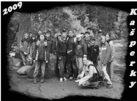
Celá třída pózuje fotografovi...