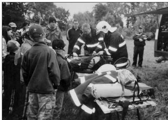
Ukázky výstroje hasičské techniky.

Za PS Starý Plzeň Pavlína Keslová a Bronislava Křížková