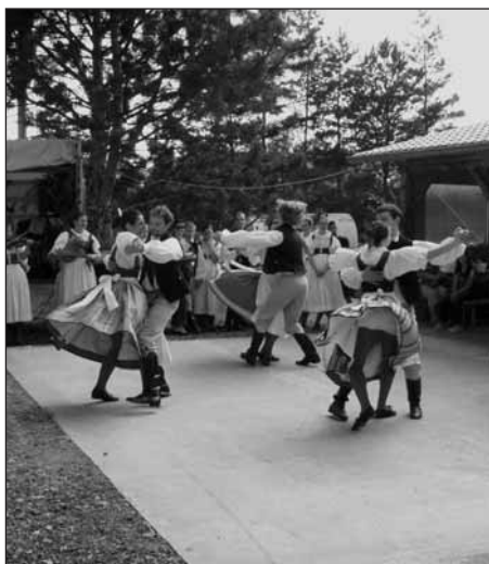
Tanečníci ze souboru Rokytka zábavu doslova roztočili...

Miluše Chrastilová SDH Sedlec