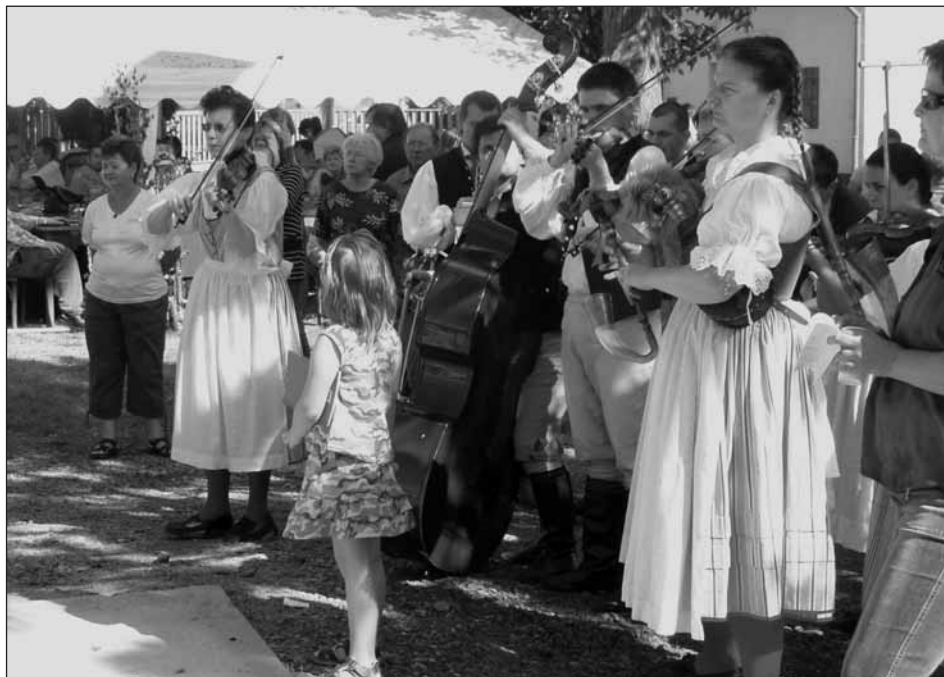
Hudebníci folklórního souboru Rokytka navodili příjemnou atmosféru.