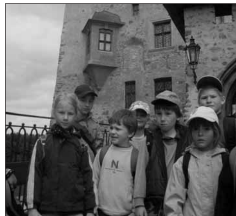
Prvnáčkové před hradem Loket.