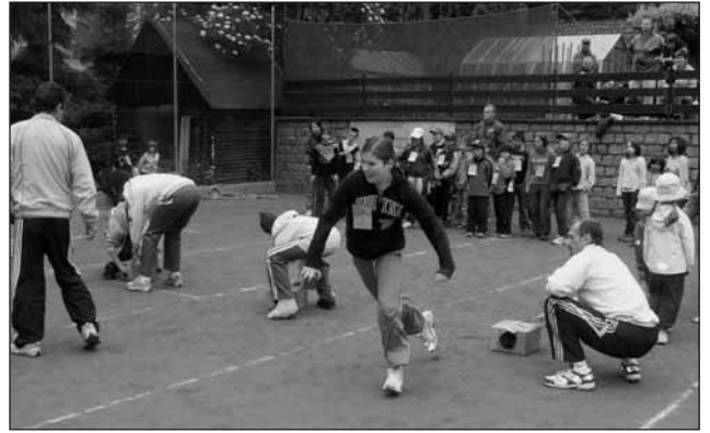
Ze života SK SPORTEAM DOLI Starý Plzenec

Ceny: putovní pohár, malé poháry, věcné ceny