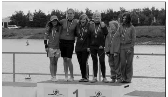
Naše stříbrné holky.