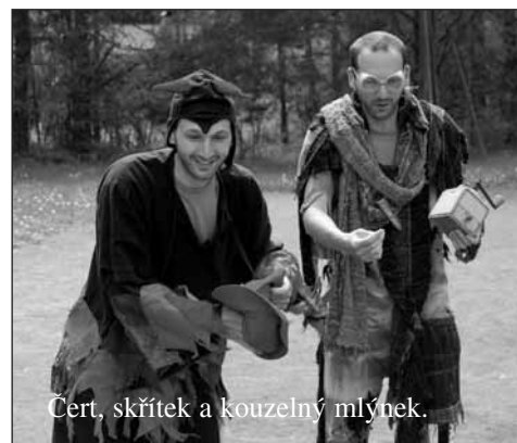
Čert, skřítek a kouzelný mlýnek.