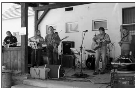
Country kapela Báboudou v akci.