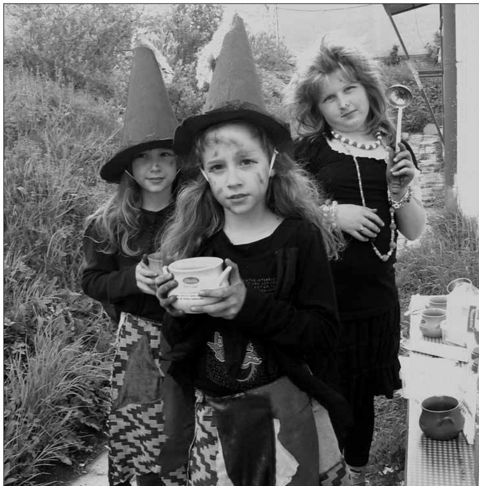
Čarodějnice se svými lektvary.