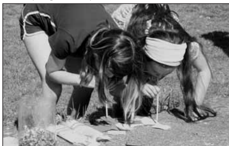
Soutěž s brčkem nebyla jednoduchá.