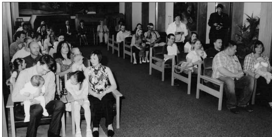
Snímek se vracíme ke slavnostnímu vítání nových občánků našeho města.