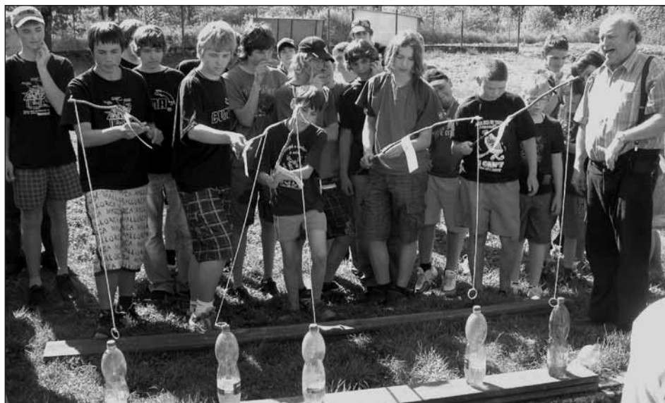
Jedna z mnoha soutěží.