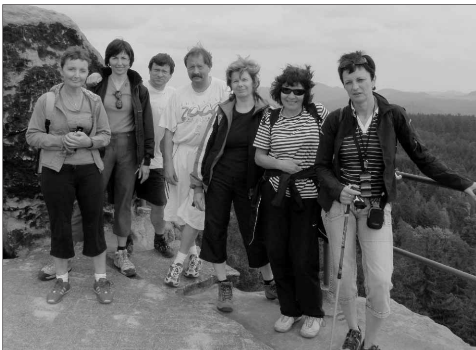
Na jednom ze skalních hradů.