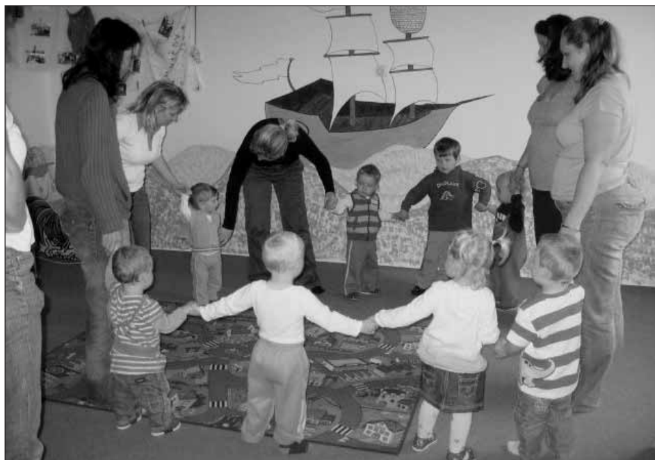
Hrajeme si a cvičíme se svými dětmi.

Táta dneska frčí aneb oslavte s námi Den otců – v neděli 14. června 2009 v čase od 15 – 18 hod. bude připraveno