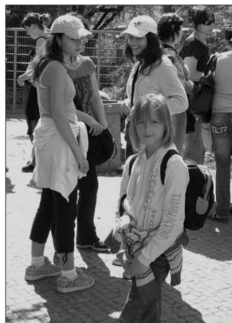
Výletníci v ZOO Praha.