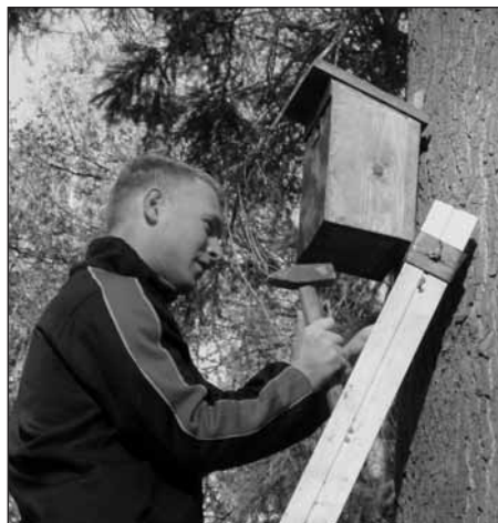
Nové ptačí budky čekají na své obyvatele.