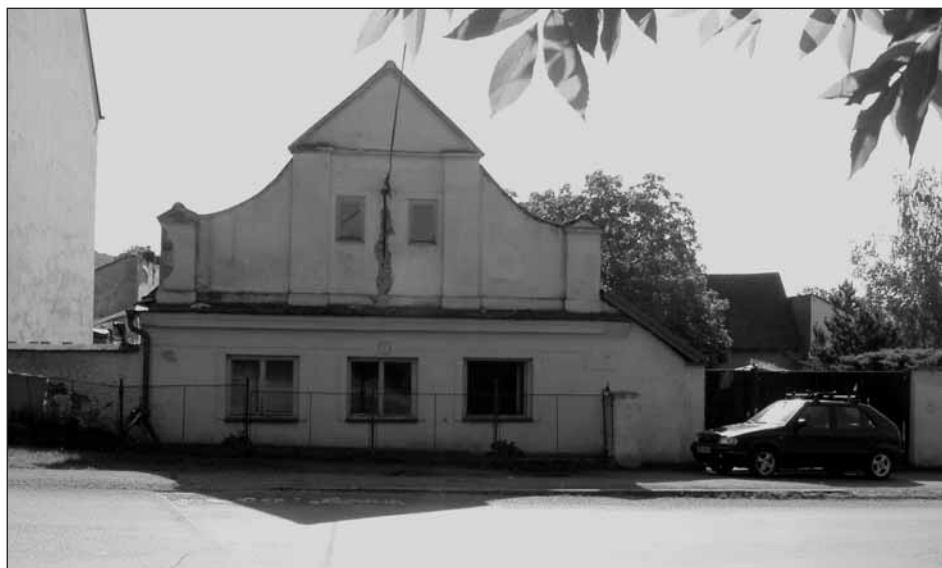
Dům č.p. 25, o jehož historii pojednává článek.