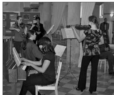
Na vernisáži výstavy koncertovali žáci ZUŠ Starý Plzenece.