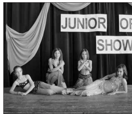
Naše mladé reprezentantky orientální show.