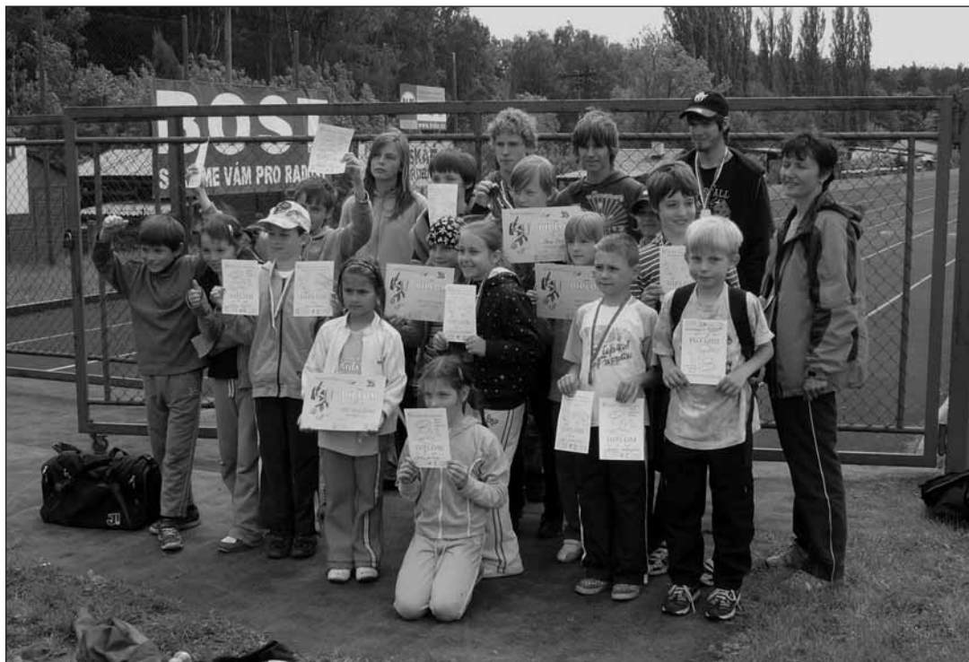
Památečná fotografie účastníků úspěšných závodů.