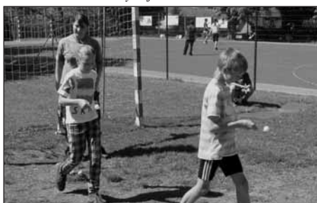
Děti při soutěžích se lžičkou a míčkem.