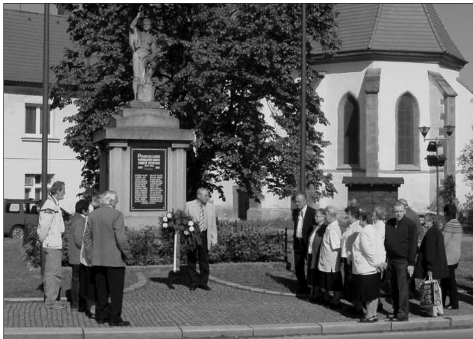
Památku obětí světových válek uctili představitelé města spolu s dalšími občany.