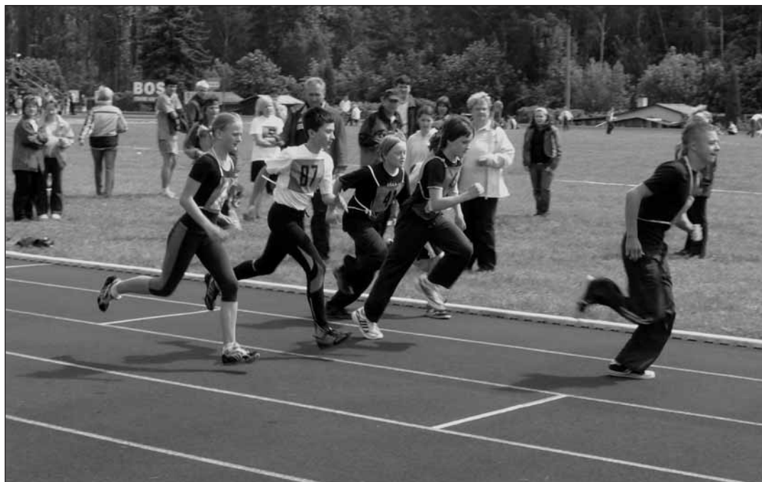
Běh na 800 m – žáci III.

Všem účastníkům přeji hodně štěstí a úspěchů v krajském kole.