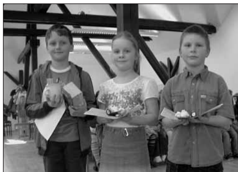
Vítězové II. kategorie.