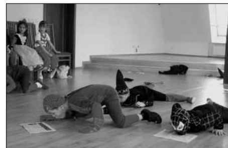
Jedna z karnevalových soutěží.