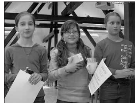
Vítězové III. kategorie.