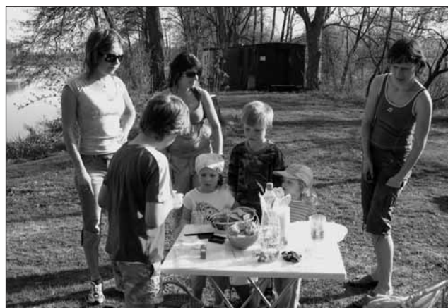
Účastníci Putování za velikonočním pokladem.

Eva Mertlová a tým RCD