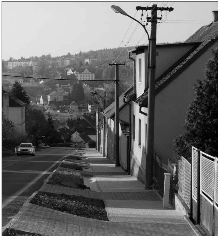
Nově vybudovaný chodník na hřbitov v Havlíčkově ulici.