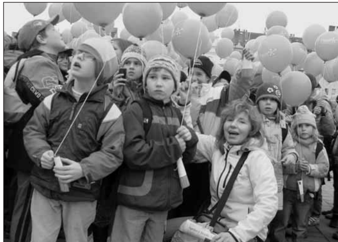
Příprava na vypouštění balónek