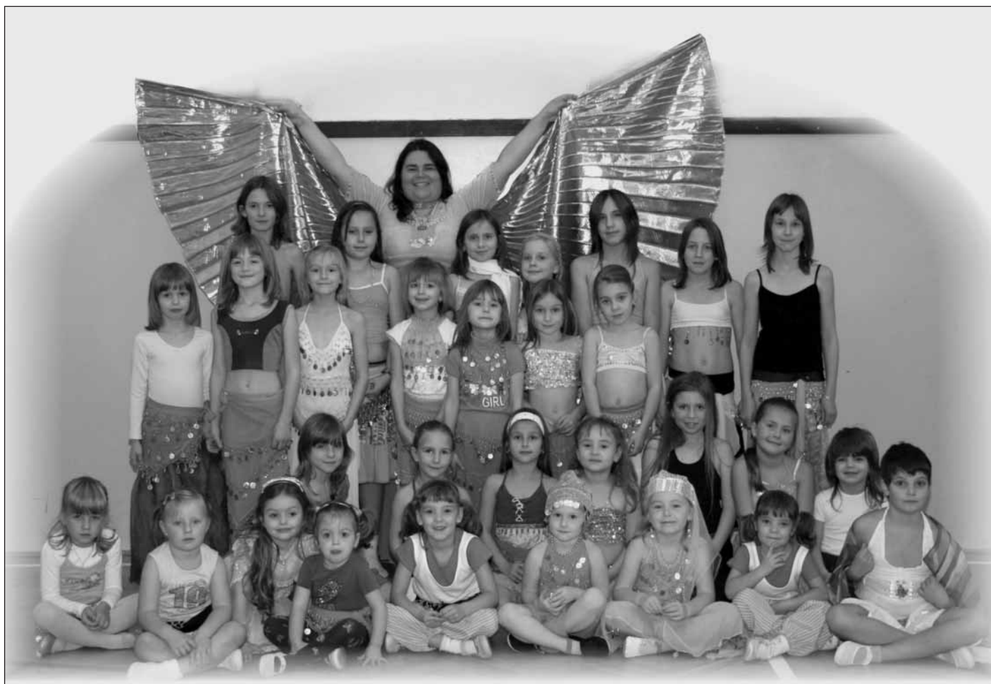
Skupina břišních tanečnic.