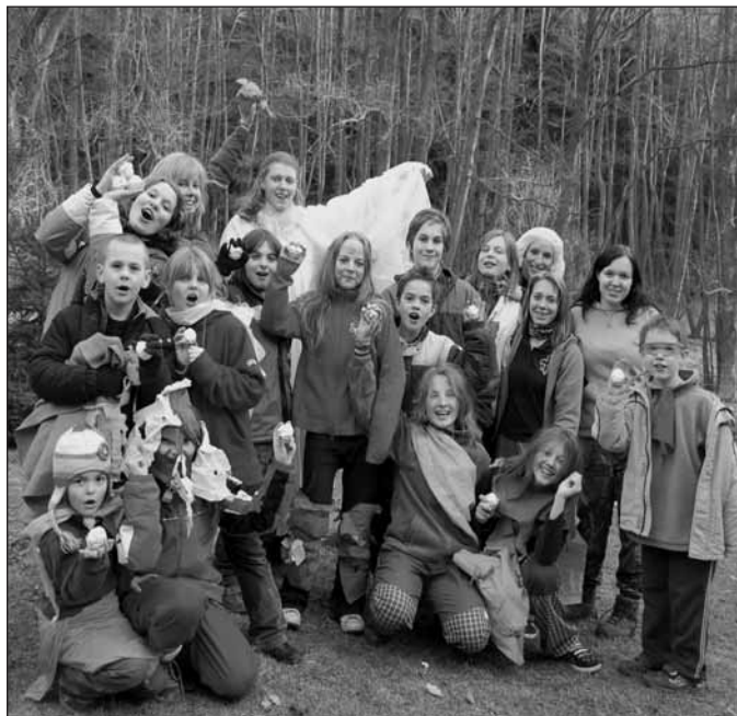
My a víla jara.

Karolína Koskubová