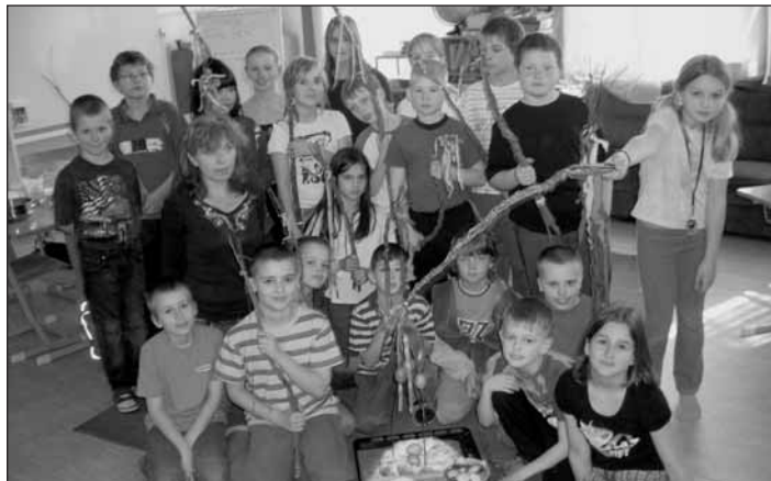
Skupinka se svými pomlázkami.