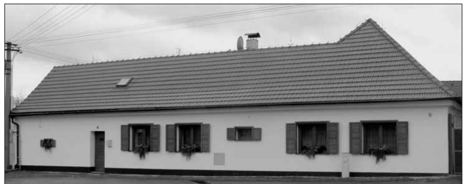
Dům č. p. 18, o jehož historii pojednává článek.