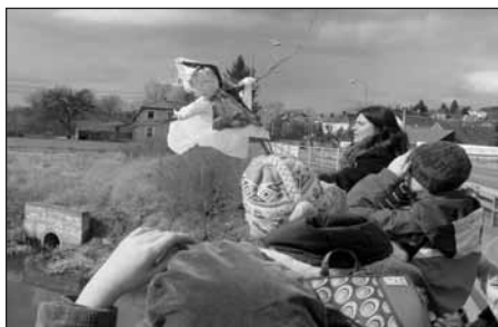
Vhození Morany do řeky Úslavy. A jaro začíná...