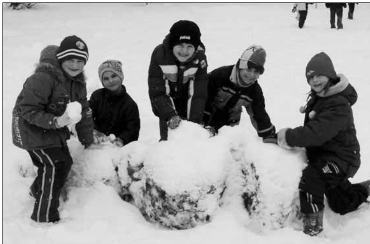
Stavba eskymáckého iglú.