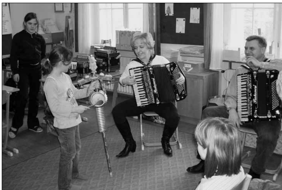
Práce s vozembochem není snadná.