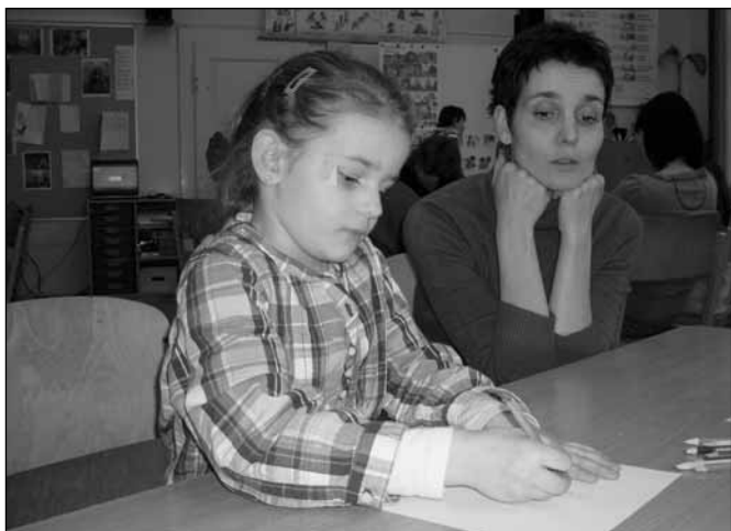
Klárka byla v lavici k nerozeznání od opravdových školáků.

Letošní zápis dětí do první třídy se konal v úterý 11. února 2009. Na zápis jsme společně s žáky 3.–5. ročníku připravili hned dvě učebny, z nichž jedna sloužila k samotnému zápisu a druhá byla pro děti a rodiče, kteří na zápis čekali. Zde si