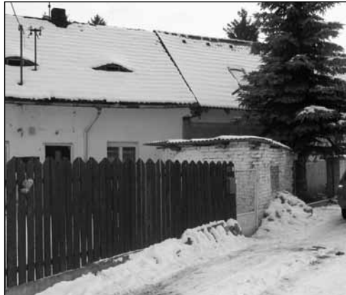
Dům čp. 214, naproti kterému trvá v i 21. století středověk.