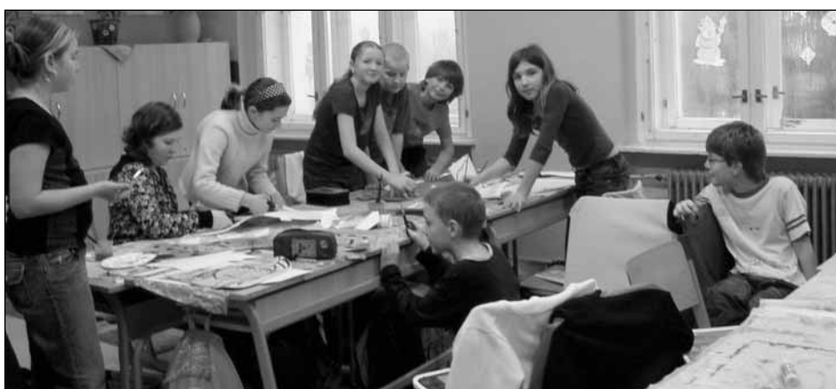
Žáci 3. a 4. skupiny ze třídy 5. A v roli oděvních návrhářů.