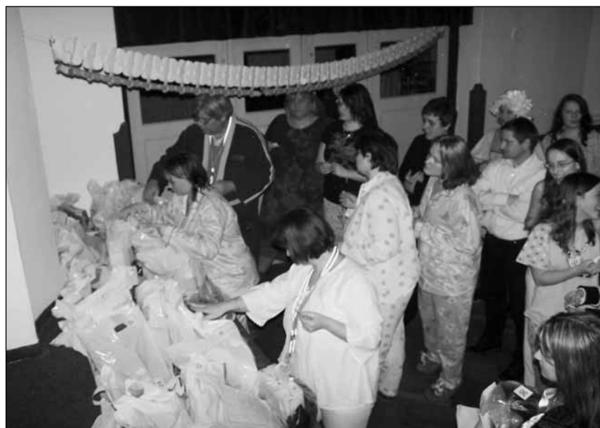
Pyžamáci při vydávání tomboly.