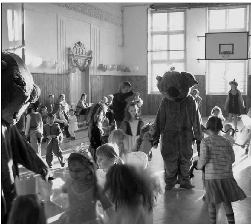
Snímek se vracíme k dětskému maskarnímu karnevalu.

Za Kolpingovu rodinu Martina Šteklová