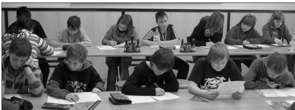
Maximální soustředění k úspěchu nestačilo.