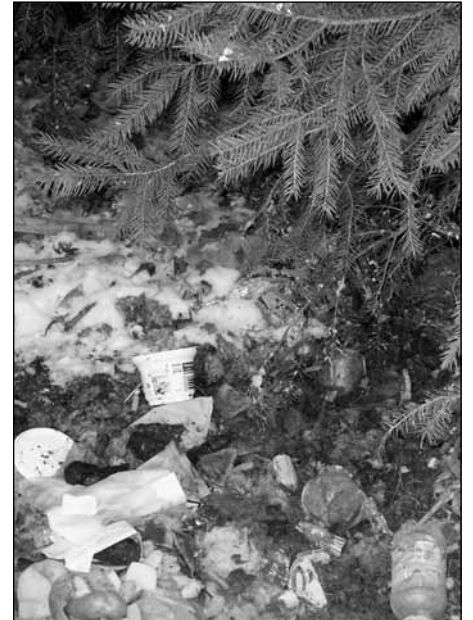
Skládka odpadků v Kozinově ulici.