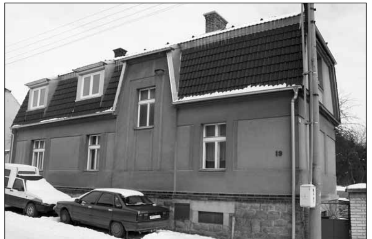
Dům čp. 13, o jehož historii informuje článek...

čestář. V roce 1932 si podal žádost o povolení stavby nového domu, kterým by nahradil původní dřevěný. Dům byl postaven na stejném místě a se stejným číslem popisným.