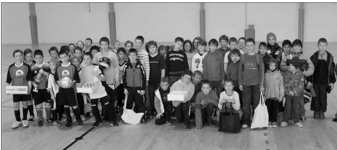
Slavnostní vyhlášení výsledků 8. ročníku Memoriálu Václava Rejška za přítomnosti všech mužstev.