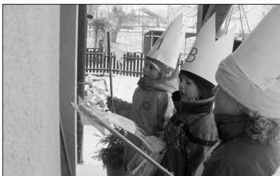
Malí sedlečtí koledníci.