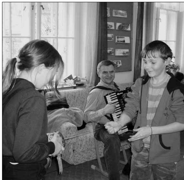
Jak se tahá za fanfrnoch.