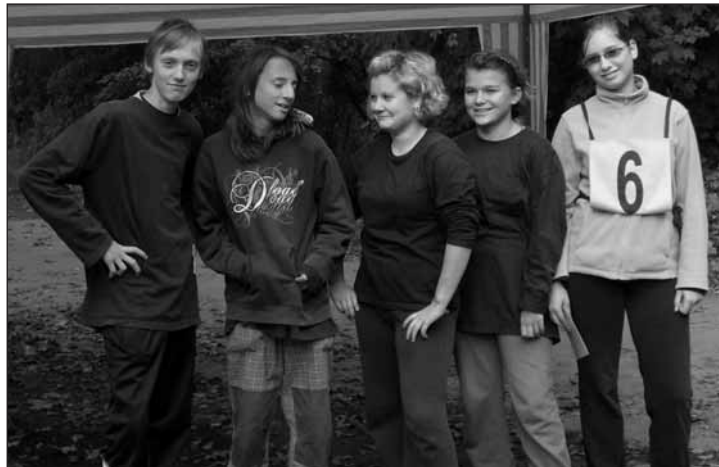
Soutěžní družstvo starších žáků.