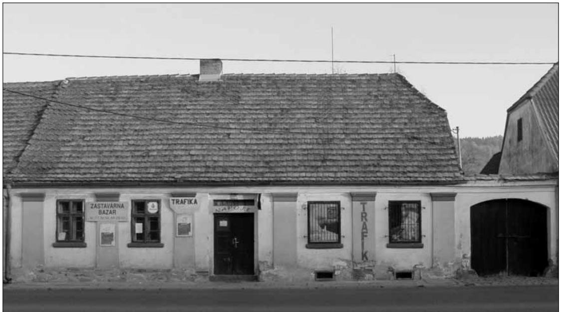
Dům č. p. 138 ve Smetanově ulici je jedním z domů, o jejichž historii pojednává článek.

Tento dům stojí za Malostranským náměstím o samotě úplně na konci zastavěného území. Majiteli byli na počátku dvacátého století manželé Vac-