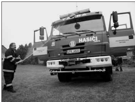
Velitel plzeňských hasičů Luboš Lenc důkladně prokřtil novou hasičskou vůz.