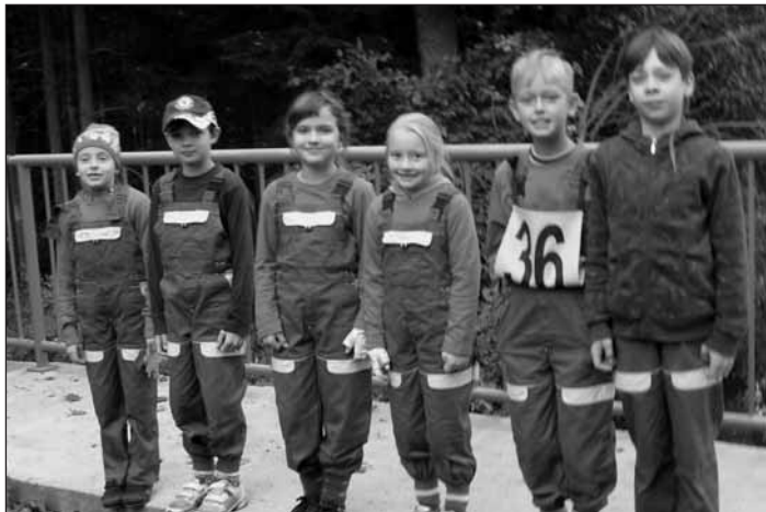
Soutěžní družstvo mladších žáků.

Za SDH Sedlec Miluše Chrástilová