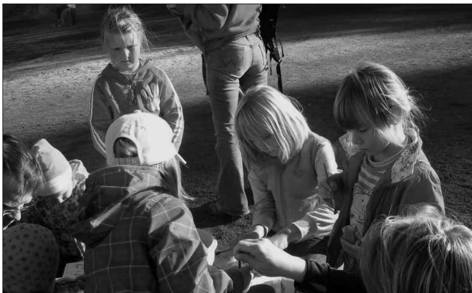
Děti se bavily při vytváření tiskátek z brambor.