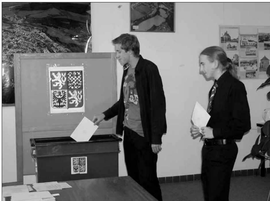
K volebním urnám si našlo při komunálních volbách cestu i dost mladých lidí.