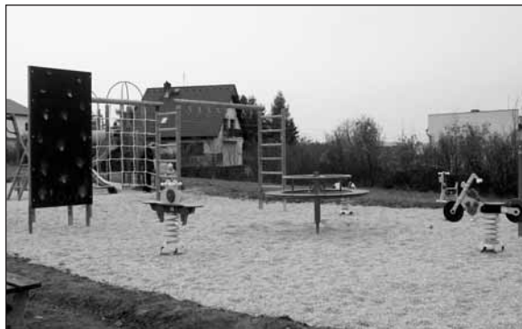
Nové hrací prvky na dětském hřišti ve Starém Plzenci si děti ihned oblíbily.