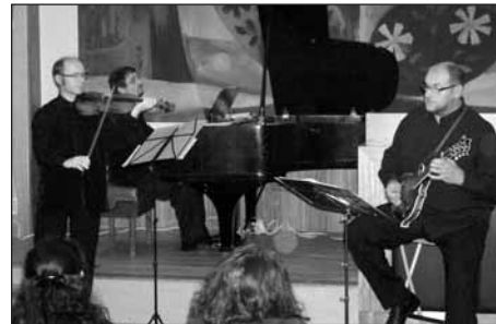
Trio Oklahoma zahájilo 26. koncertní sezónu.