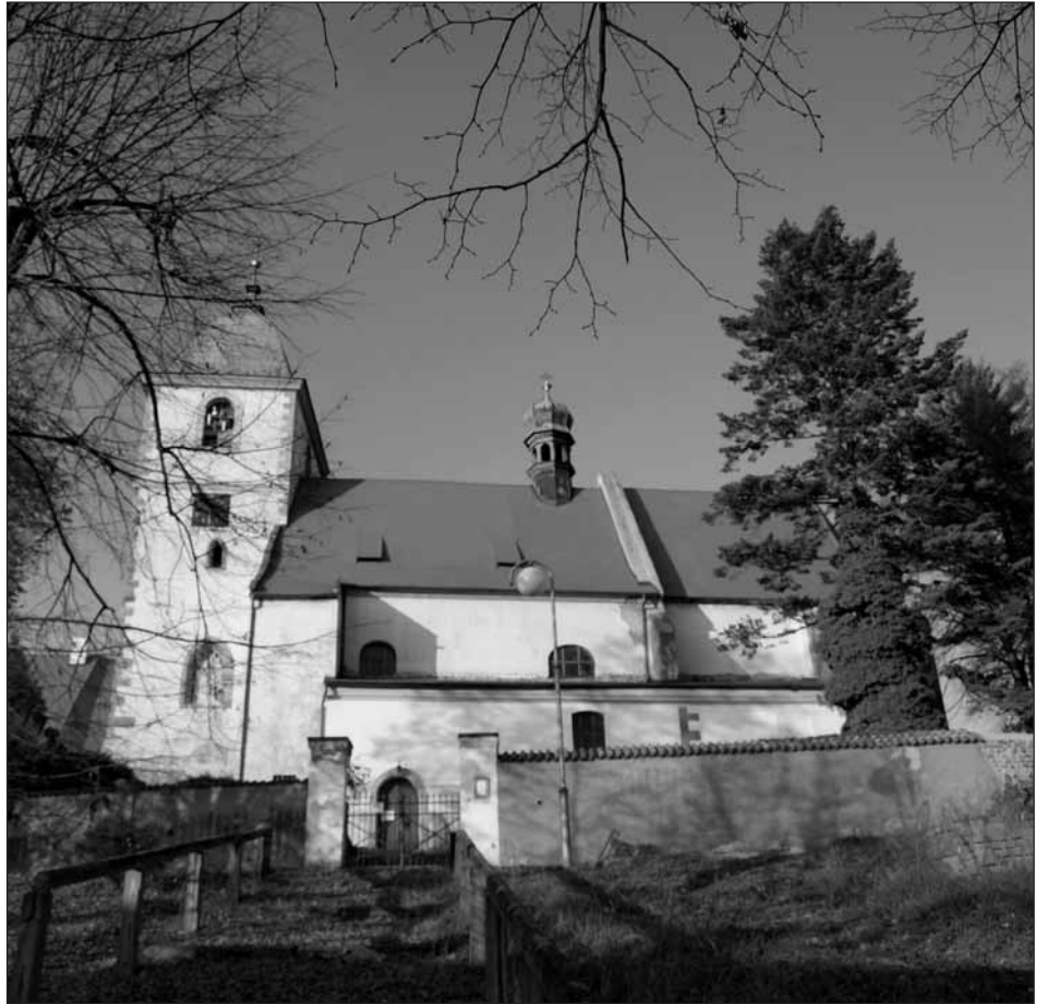
Kostel Narození Panny Marie ve Starém Plzenci.

Letos se v kostele opravovala omítka na severní stěně kostela a probíhá výmalba pod kůrem a přístavků kostela. Začaly se též práce na obnově kaple Božího hrobu, která je situována v přední části severní strany kostela. Byla v ní okopávána do výše více než jeden metr omítka, která