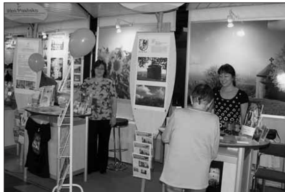
Město Starý Plzeňec se prezentovalo v sousedství Občanského sdružení Aktivios a Mikroregionu Radyň.