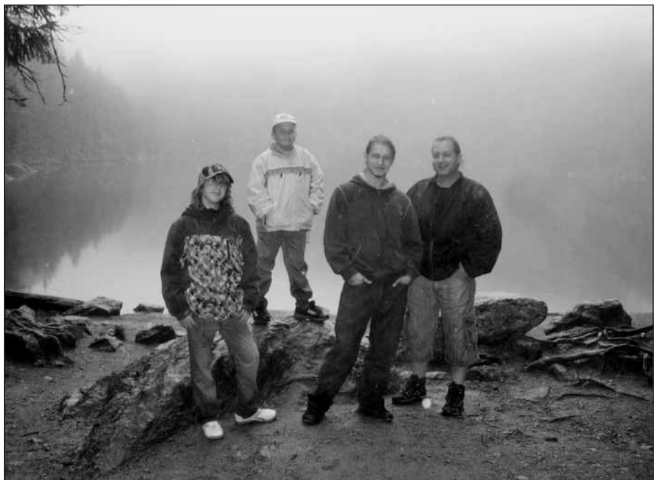
U Čertova jezera.

Voda, topení, kanalizace, instalatérské a topenářské práce