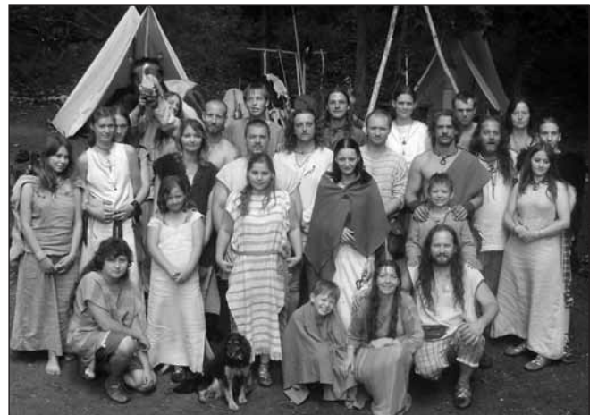
Keltská divadelní společnost Vousův kmen.