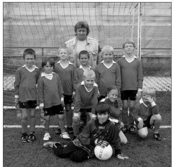
Nejmladší naděje plzeňské kopané.