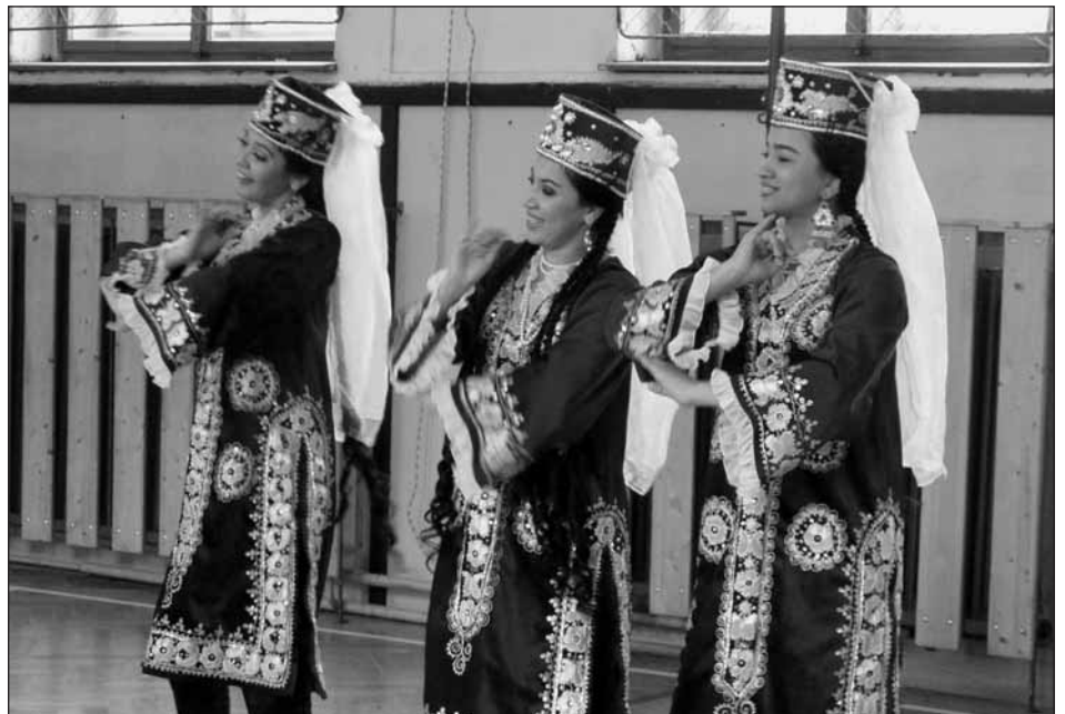
Folklorní soubor z uzbeckého Taškentu.