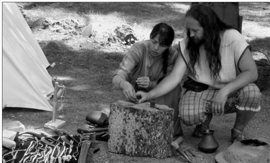
Ukázka ražby mincí.

Místo: Staroplzenecká galerie, Smetanova 932 Čas: 17.00 hod. Vstup volný. Pořadatel: město Starý Plzeňec, K-Cent- rum, městská knihovna Kontakt: info.plzenec@staryplzenec.cz, tel.: 377 183 662, 377 183 659, www.sta- ryplzenec.cz Výstava potrvá do 4. listopadu 2010.