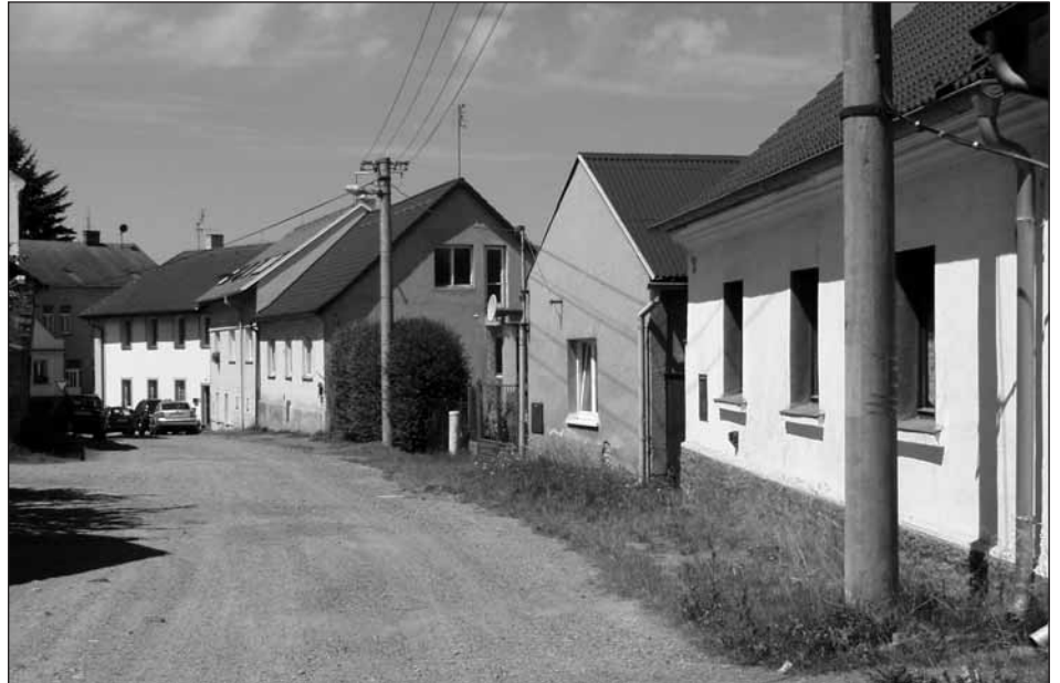
Domy v ulici Svatoopluka Čecha, o jejichž historii pojednává článek.