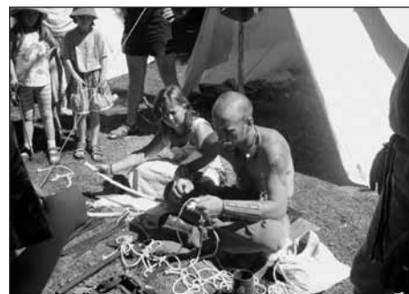
Keltský válečník předvádí výrobu provazů.