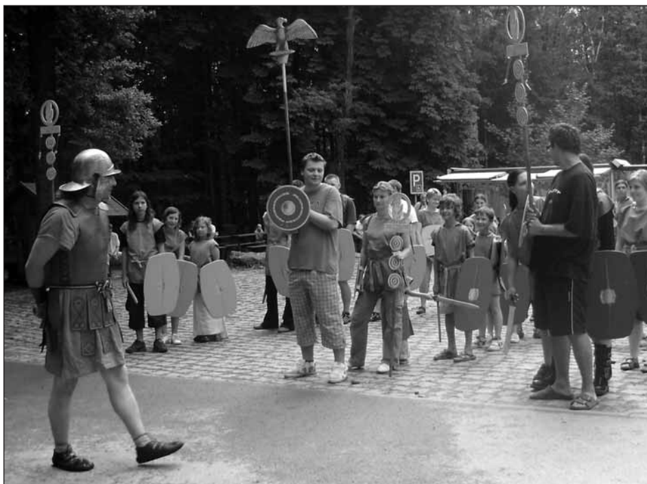
Šikování římských legií k boji proti Keltům.

Vysvětloval, že Kelti nebyli žádní primitivové: tito obávaní válečníci byli zároveň skvělými řemeslníky. Například uměli velmi dobře pracovat se dřevem. Dělali z něj nejen nádobí tvarů, které známe dnes, ale třeba i roubené domy, zdobené řezbou - nebydleli v chatrčích, jak si dnes představujeme. Znali i soustruh. Nádobí vyráběli na hrncířském kruhu, různě je zdobili a pak vypalovali v pískách (kromě velkých zásobnic na obilí). Většina z nás také poprvé ve vesničce měla možnost vidět velký tkalcovský stav, který známe již z neolitu. Ukázky tkaní z vlny i lnu nás přesvědčily, že na něm bylo možno zhotovit kvalitní látky. (Keltové dokázali kromě klasické plátěné vazby vytvářet vazby i daleko složitější,