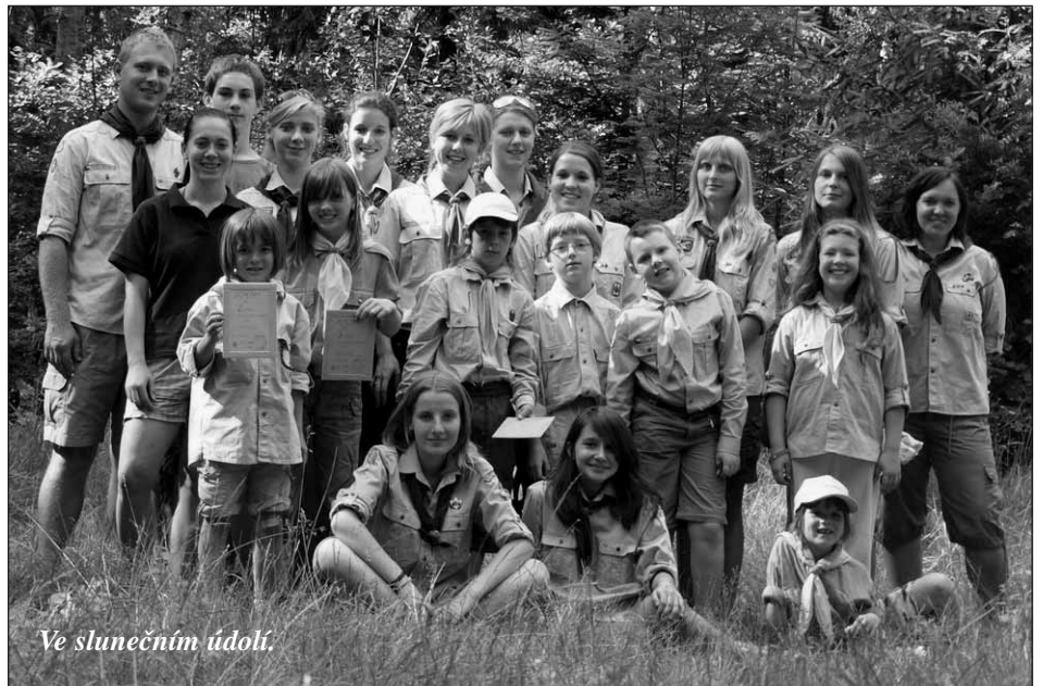
Ve slunečním údolí.