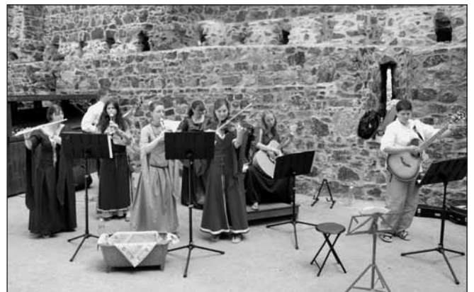
V hradním paláci Radyně vystoupila keltská kapela De Domhanaigh.