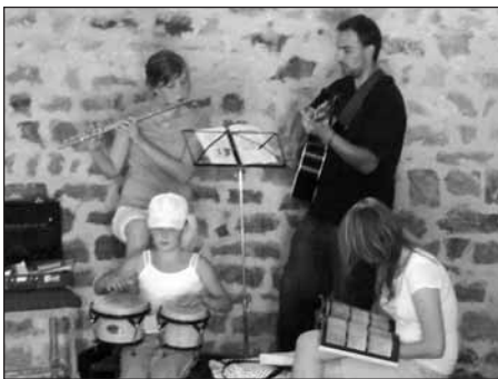
Hudba při mši.

Toto strohé oznámení ovšem nedokáže zprostředkovat celkový hluboký a mnohotvárný duchovní zážitek celého odpoledne. Především k tomu bylo nápomocno překrásné počasí a sama příroda, po staletí na nás hluboce působící. Z propastí časů na nás hledí místo nabitě pozitivní energií – Keltové i jejich předchůdci Hůrku dobře znali a před staletími využívali jako pohřebiště a možná i jako kultovní místo. Je ostatně zvláštní, že proti rotundě roste jejich nejuctívanější strom, strom života - dub. V jeho stínu druidové věštili, Slované pod ním obětovali potraviny... a my dneska zjišťujeme, že vibrace dubu jsou schopny navrátit rovnováhu narušenému organismu. I když výzkumy prokázaly, že naše DNA je částečně keltská (dokonce jsme geneticky méně Slované, než si myslíme - asi tak