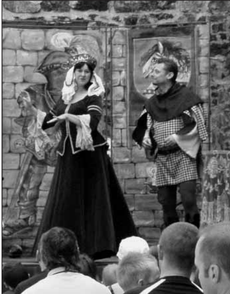
Na Radyni se usídlilo strašidlo Bublifuk.