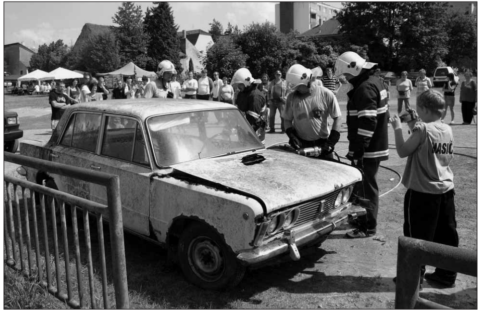
Stříhání vozidla hydraulickými nůžkami.

Hned na začátku byla ukázka Soptíků z Plzně-Bolevice, kteří mají nádherně připravené vystoupení z upraveného zásahového vozidla s následným odstraňováním překážek v podobě padlého stromu. I při ukázce činnosti se staříčkou stříkačkou v podání kolegů z Nezbytic se bylo na co dívat. Následná soutěž v požárním útoku prověřila zúčastněná družstva, jak je každý připraven na opravdový požární zásah, neboť se jednalo o způsob provedení jako u zásahu včetně překážek. Po celou dobu byla vystavena na prostranství současná požární technika z HZS Plzeň a okolních sborů včetně podrobného výkladu. Dále si každý mohl vyzkoušet činnost při stříhání vozidla hydraulickými nůžkami. Ze se nejedná o práci lehkou, o tom se na vlastní kůži přesvědčilo i několik odvážných žen. Škoda jen, že na poslední chvíli byla odvolána výšková