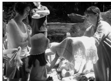
Keltské ženy ukazují hotové ručně utkané látky.