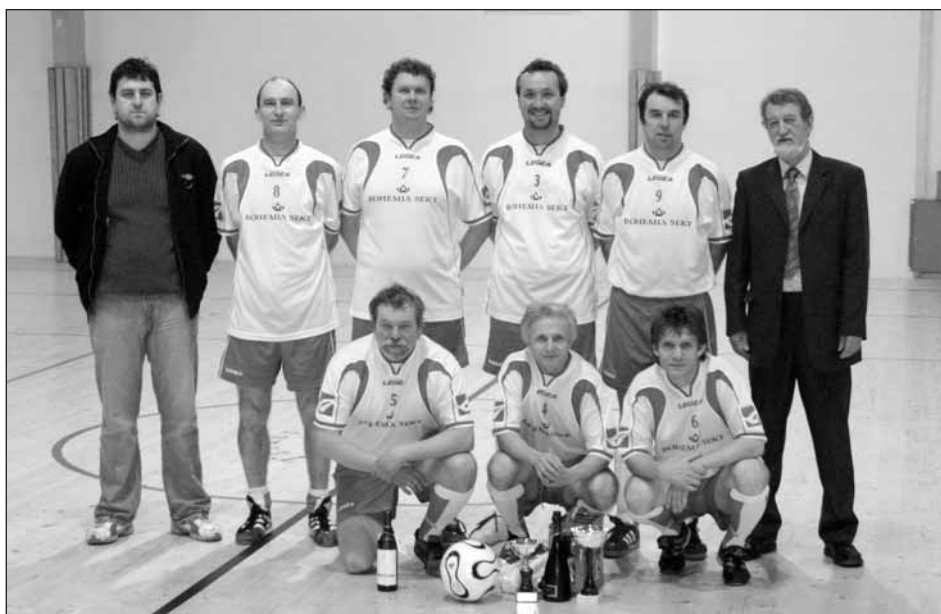
SK Starý Plzenec jako vítěz Memoriálu J. Sutnara v roce 2009.