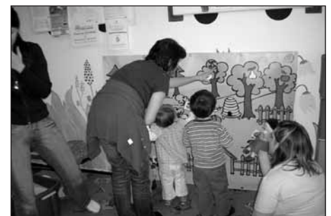
Ukázková hodina Ostrova objevů.