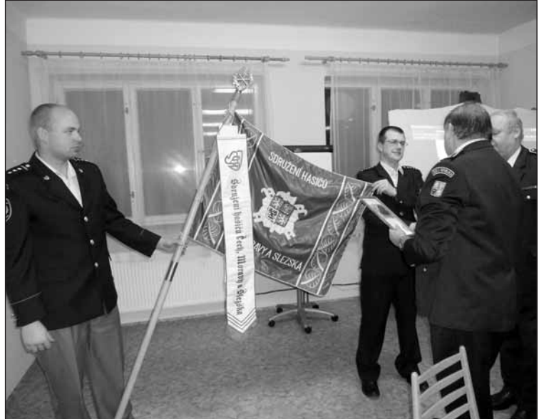
SDH Starý Plzenec byl ke svému 130. výročí založení vyznamenán Stuhou III. stupně k Čestnému praporu Sdružení hasičů Čech, Moravy a Slezska.

Závěrem byly předneseny příspěvky přítomných zástupců složek a organizací.