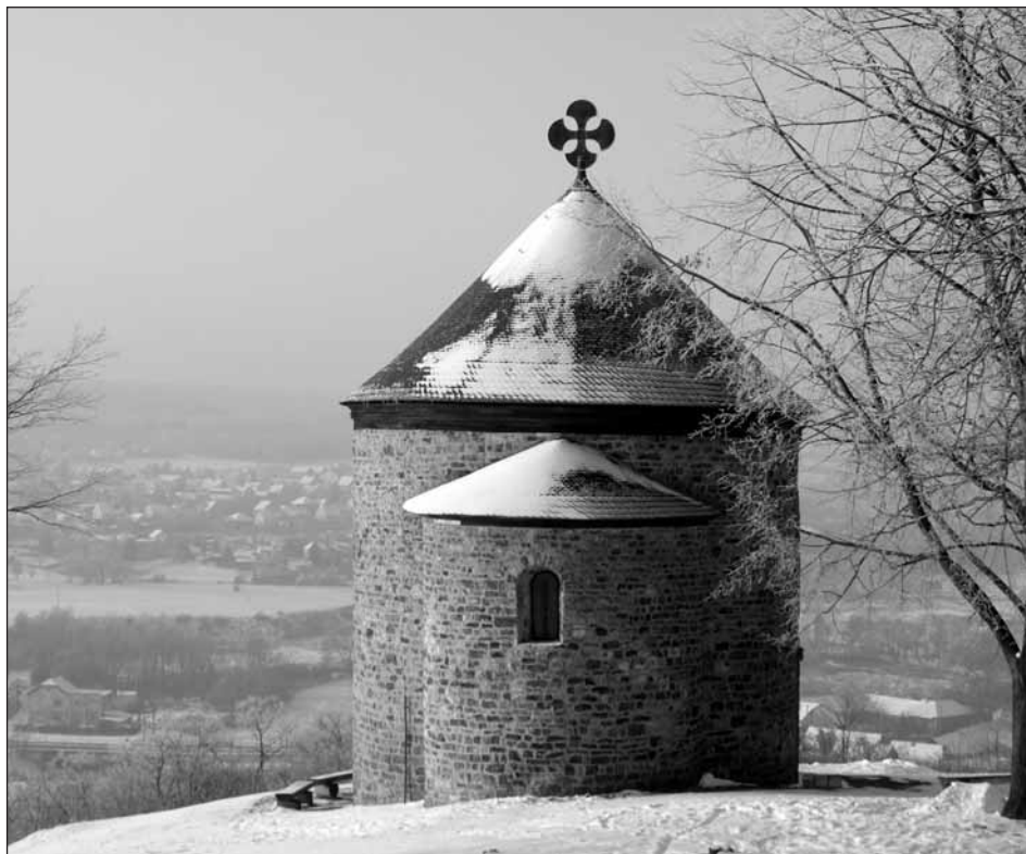
Zimní romantika Starého Plzenec.

schválila vydání novelizovaného Organizačního a provozního řádu organizační složky Pečovatelská služba, novelizovaných Pravidel pro poskytování pečovatelských služeb a pro podávání a vyřizování stížností na kvalitu nebo způsob jejího poskytování a novelizovaného Sazebníku úhrad úkonů pečovatelské služby účinného od 01.01.2011;