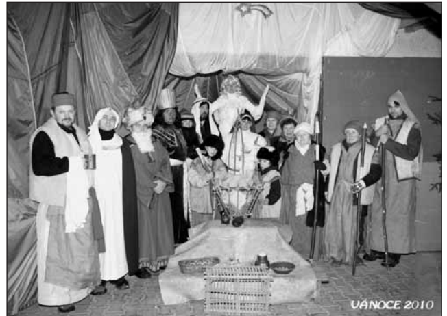
Představení betlémského příběhu se letos poprvé odehrálo také v Sedlci.