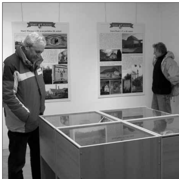
Výstavu o historii Starého Plzence je možné ve Staroplzenecké galerii zhlédnout do 24. února 2011.