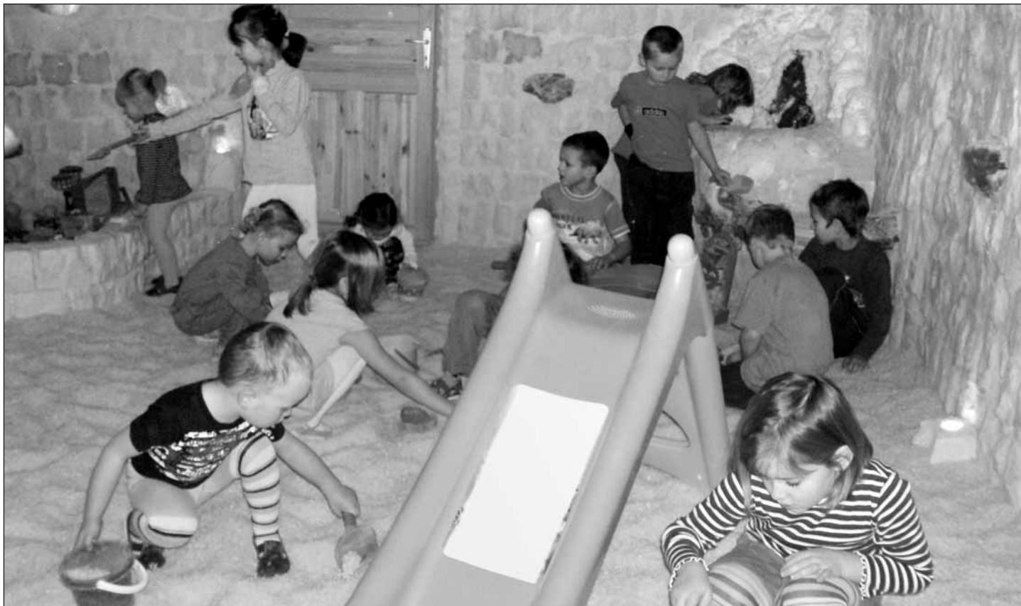
Děti 1. a 5. třídy MŠ St.Plzenec si užívají v solné jeskyni.