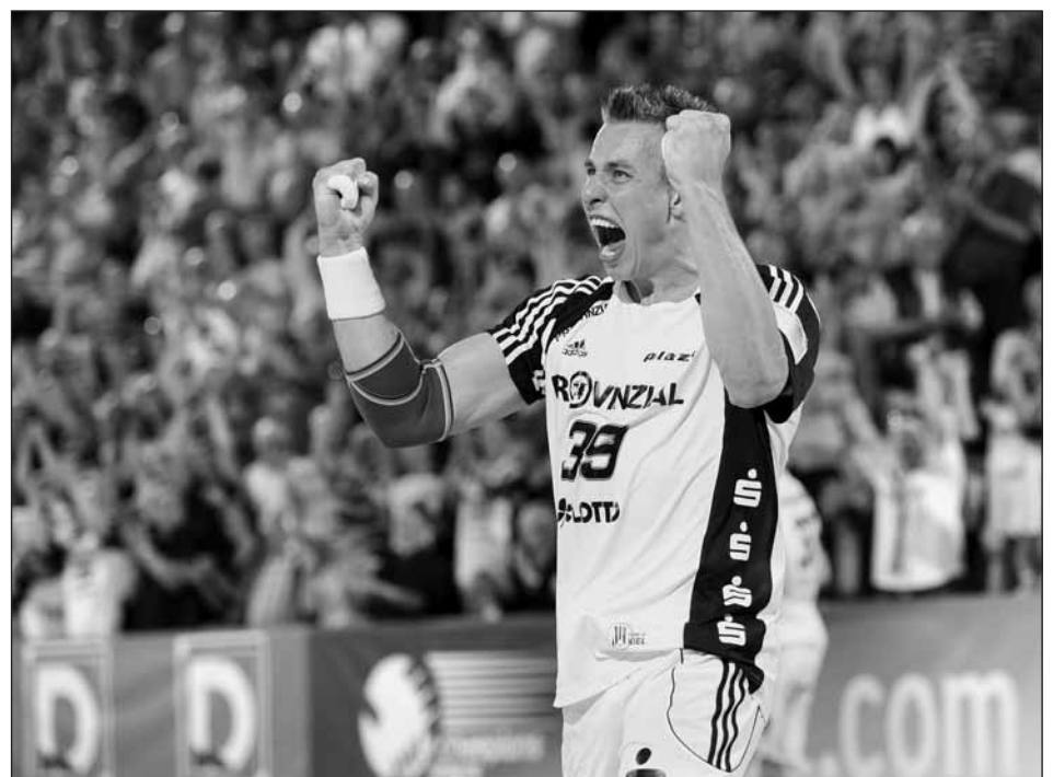
Nejlepší házenkář světa staropluženecký rodák Filip Jícha.