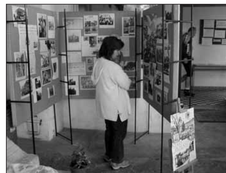
Výstava k 65. výročí osvobození našeho města zaujala nejen pamětníky.