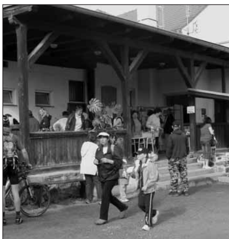
Čilý ruch panuje v areálu sokolovny. Turisté vyražejí na pochod a na trhu s květinami se obchoduje.

V areálu místní sokolovny se u příležitosti Plzeňské padesátky a v rámci oslav 65. výročí osvobození Starého Plzněce konalo zábavné odpoledne s posezením a občerstvením, při kterém hrála k poslechu country kapela Báboudou. Velký dík patří oddílu plzeňských skautů, kteří pro tuto příležitost připravili pro děti skvělé zábavné hry a soutěže.