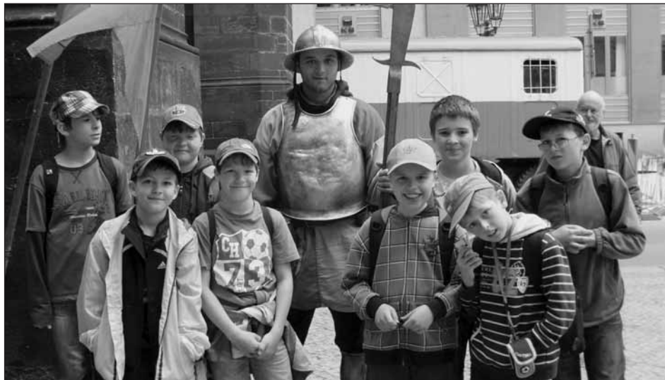
Děti sedlecké základky před Prašnou bránou, ve které na ně čekala expozice o husitství.

Na 13. 5. se těšily snad všechny děti sedlecké základky. Mohly si totiž do školy donést své oblíbené zvířátko. Děti nejprve v rámci výuky sestavovaly povídky o svých zvířatech. Poté jsme se všichni sešli na školní zahradě, kde každý mohl představit své zvířátko a něco o něm povědět. Velkým pomocníkem byl tentokrát mikrofon a zesilovač, takže si mnohé děti připadaly jako opravdoví reportéři. Kromě pejsků, králíčků, morčat a různých druhů křečků, jsme si mohli prohlédnout Agapor-nise škraboškové, překrásné papoušky, které chová jeden z našich žáků.