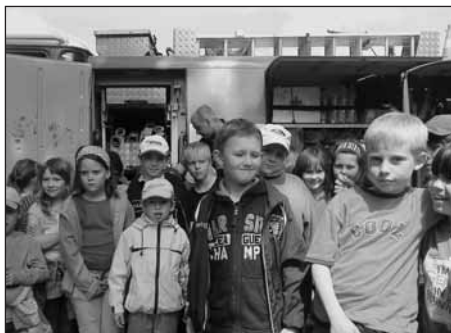
Děti byly nadšené prohlídkou hasičských vozidel.