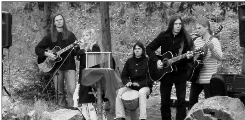
Melodie středověkých irských balad dotvářela správnou atmosféru prostředí.