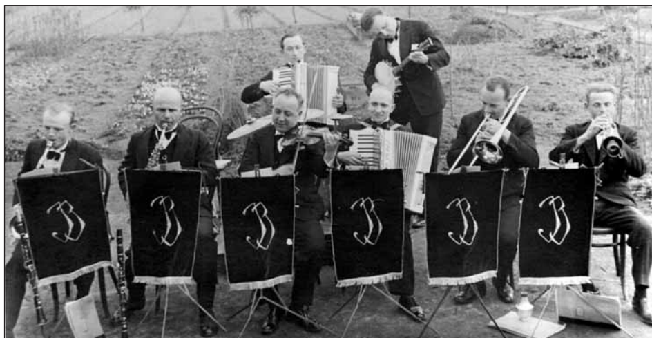
Jůzův jazz orchestr.