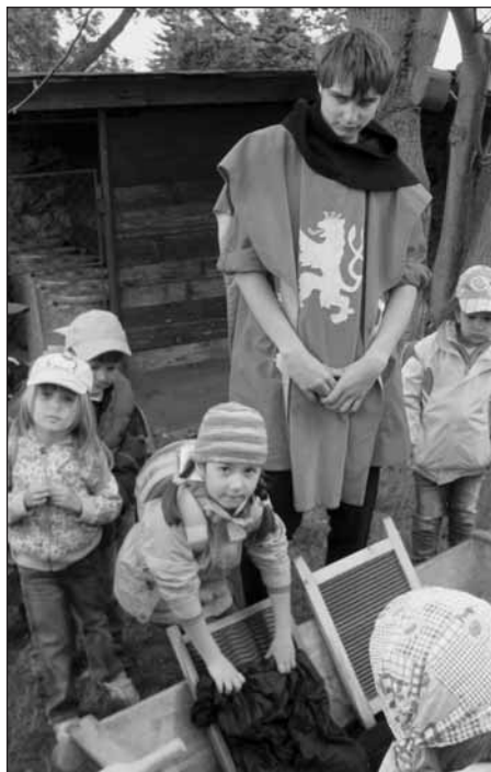
Jak se pralo prádlo...