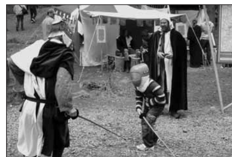
Kordový souboj pro děti.