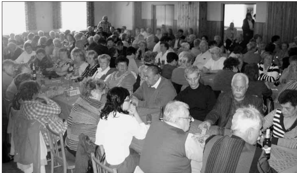
Valné hromady OSZP se zúčastnilo celkem 175 členů.