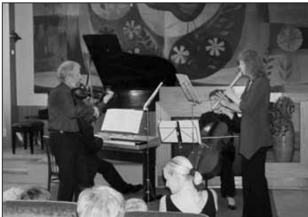
Soubor barokní hudby ZUŠ Starý Plzenec.