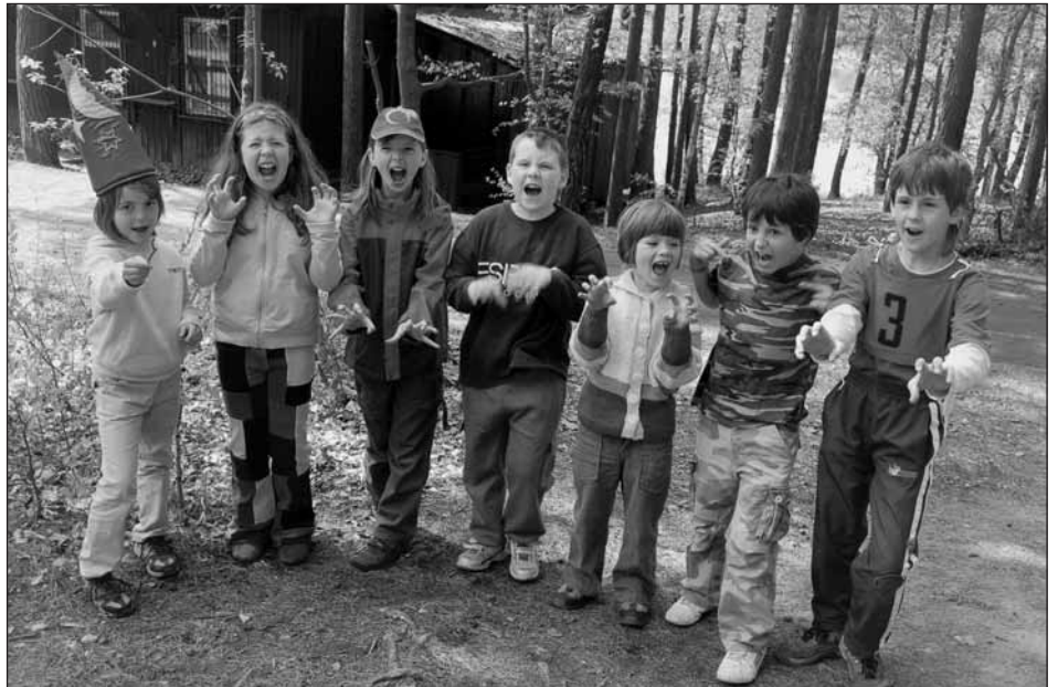
Naši Tygři před závodem.