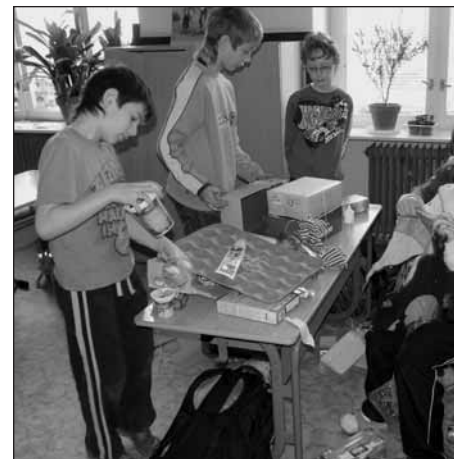
Výroba předmětů z nasbíraného materiálu.