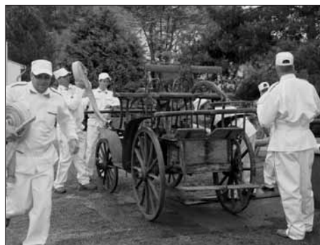
Koněspřežné stříkačky s obsluhou.

V soboru 15. května jsme pak v areálu HZ společně oslavili 120. výročí založení HS Sedlec. Hasiči všech věkových kategorií soutěžili v požárních soutěžích a vyvrcholením byla soutěž s koněspřežnou stříkačkou, při které se soutěžící i diváci vrátili trochu do historie. Trochu kontrastu s tím pak přinesla ukázka hasičského záchranného sboru Plzeň, který předvedl práci s vysokozdvižnou plošinou, která patří k nejmodernější