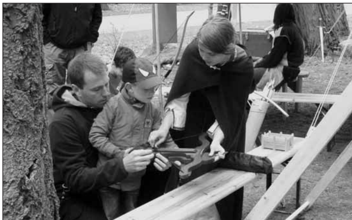
Střelba z kuše pro děti.