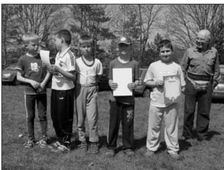
Vítězové kategorie Žáci II.