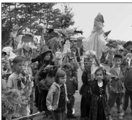
Slet čarodějnic okamžik před vyhodnocením.