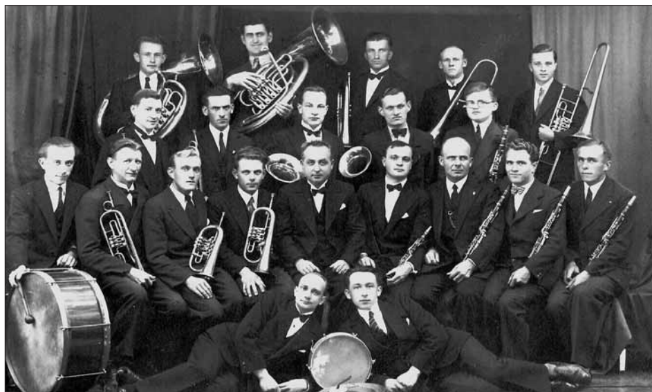
Jůzova dechová kapela.

Čechách a pustil se i do Paříže, kde v roce 1937 působil šest měsíců.