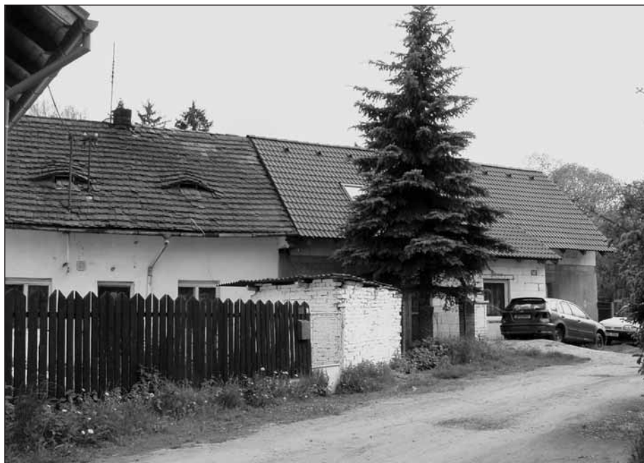
Domy č.p. 92 a č.p. 214 v Kozinově ulici, o jejichž historii pojednává článek.

Dům č. p. 91 stojí v Husově ulici poněkud