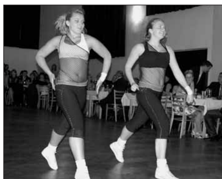
V rytmu aerobiku vystoupila dívčí taneční dvojice Wellness team.

Zveme všechny děti, jejich rodiče, (pokračování str. 13)