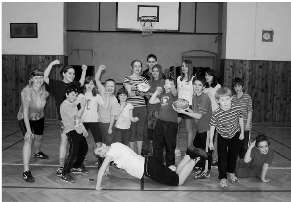
Sportovní odpoledne v plzeňské sokolovně.

Začátkem března, přesněji řečeno šestého, jsme se sešli v plzeňské sokolovně na sportovně-zábavném odpoledni. Po důkladné zahřívací rozvíčce začalo zápolení a soutěžení, jak mezi družstvy, tak i mezi jednotlivci. Děti procvičovaly nejen svoji kondičku, ale také postřeh, bystrost či znalost uzlů. Zakončením sportovního odpoledne bylo slavnostní vyhlášení. Velmi nás překvapila vyrovnanost týmů -