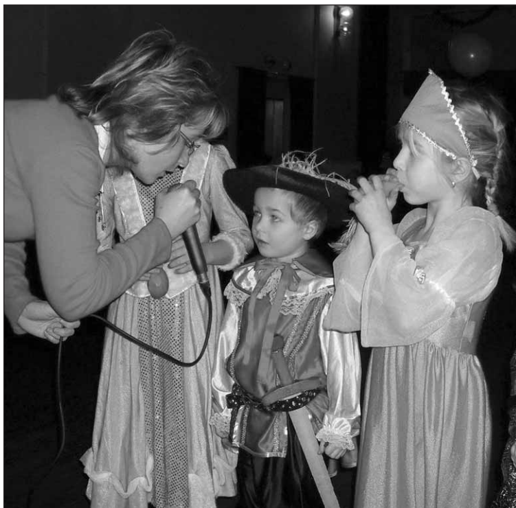
Fotografie ze soutěže o nejlepší masku.

Za PS Starý Plzeňec Petr STEINER Foto archiv