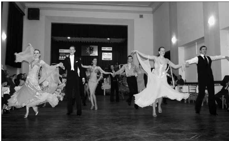
Taneční škola Gregoriades předvedla ukázky standardních a latinsko-amerických tanců.