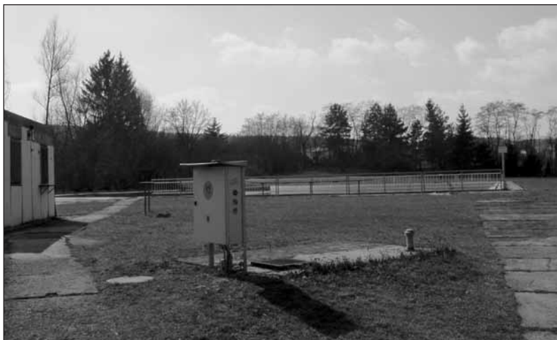
K pronájmu nabízený areál víceúčelové požární nádrže v Husově ulici.