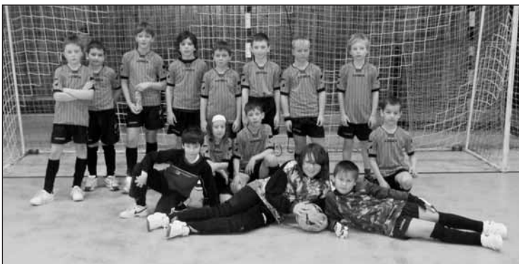
Družstvo Starý Plzeňec, které obsadilo v těžké konkurenci 5. místo.