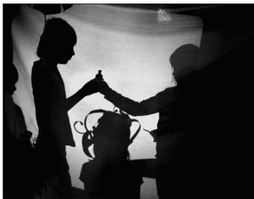
Malí herci z dramatického souboru ZUŠ nás prostřednictvím stínového divadla zavedli do světa světla a stínů.