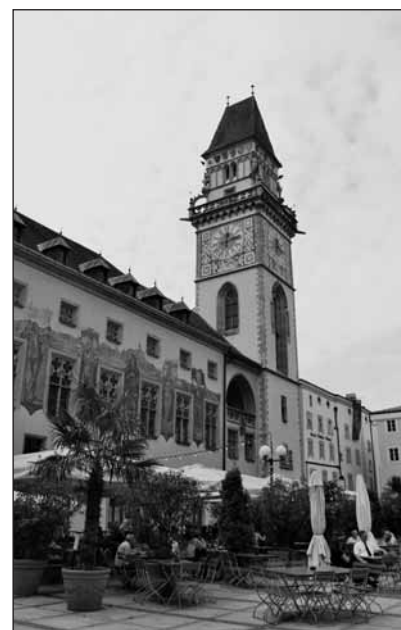
Městská památková rezervace v Prachaticích.