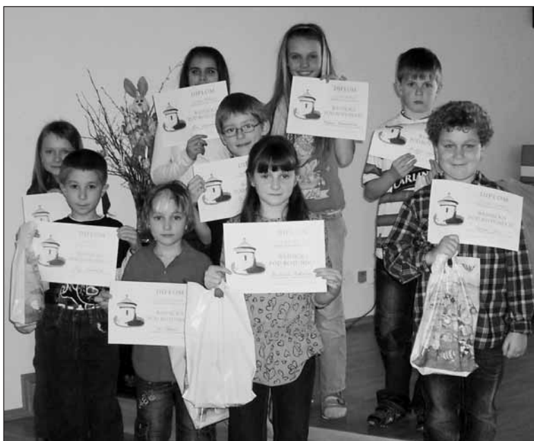
Ve čtvrtek 18. 3. se setkali žáci Základních škol Starý Plzenec, Sedlec, Štáhlavy a Tymákov při recitační soutěži Básnička pod rotundou. Na snímku jsou vítězové 10. ročníku.

V pátek 5. března zavítalo do naší školy Divadélko Kuba se svým představením Pletené pohádky. Žáci MŠ a také první, druhé a třetí třídy měli možnost vidět několik vtipných minipohádek o zvířátkách, které vždy propojovalo důležité ponaučení. Dětem se velice líbily vtipné dialogy a také originální upletené loutky zvířátek a zajímavé kulisy.