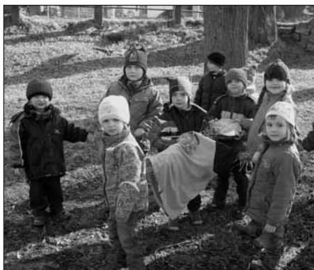
Děti s Morenou.