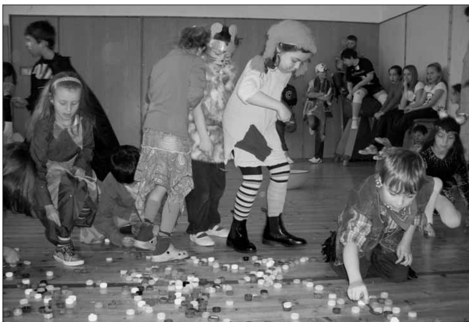
Soutěžní v plném proudu aneb Pipi při práci.