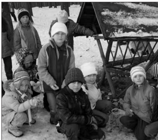
Děti se svoji nadílkou pro zvířátka.