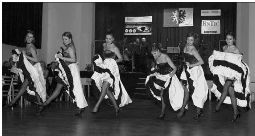
Před půlnocí sál tleskal kankánovým tanečnicím.