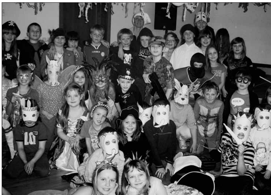
V aule základní školy se sešlo na padesát různých masek.