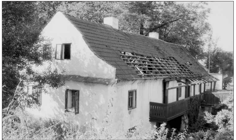
Snímek si připomeňme jeden z posledních dnů domu č. p. 101, o jehož historii vypráví autor článku.