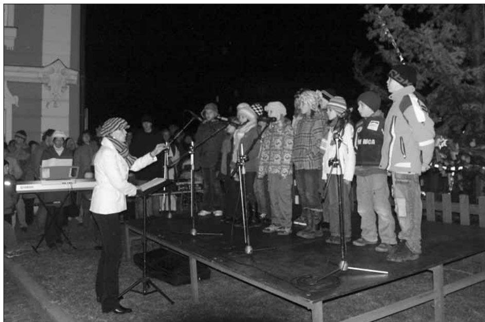
U vánočního stromu se sešly stovky lidí...

Vůně svařeného vína a teplého čaje, který pro návštěvníky připravila Staroplzenecká restaurace BOHEMIA SEKT, dotvářela pravou vánoční atmosféru.