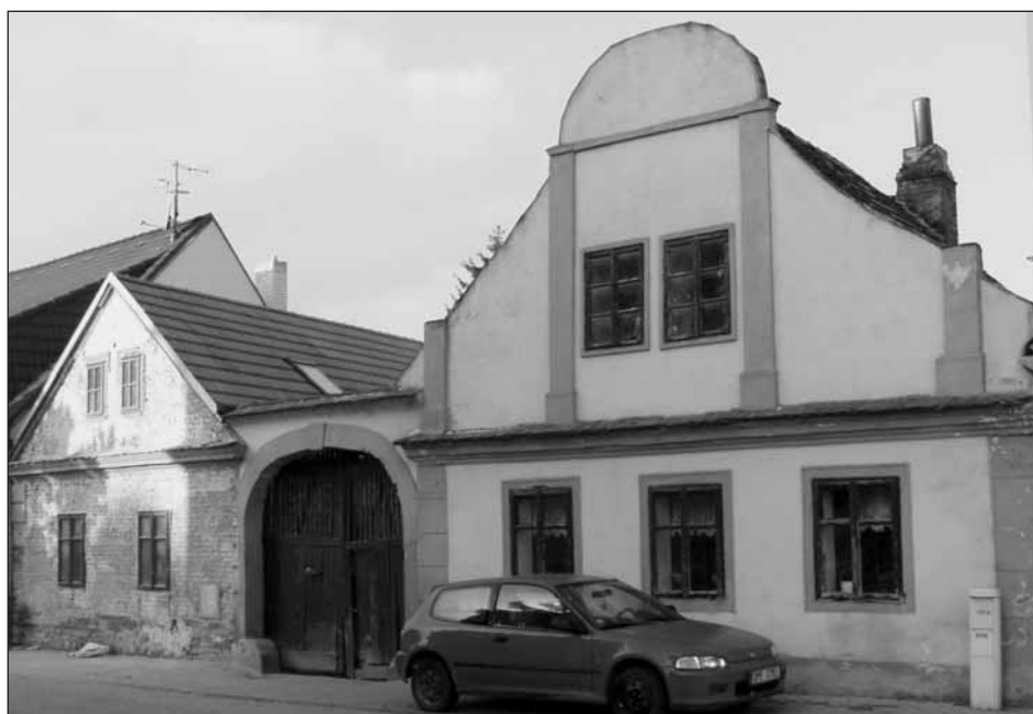
Statek v Baslově ulici, o jehož historii vypráví článek.