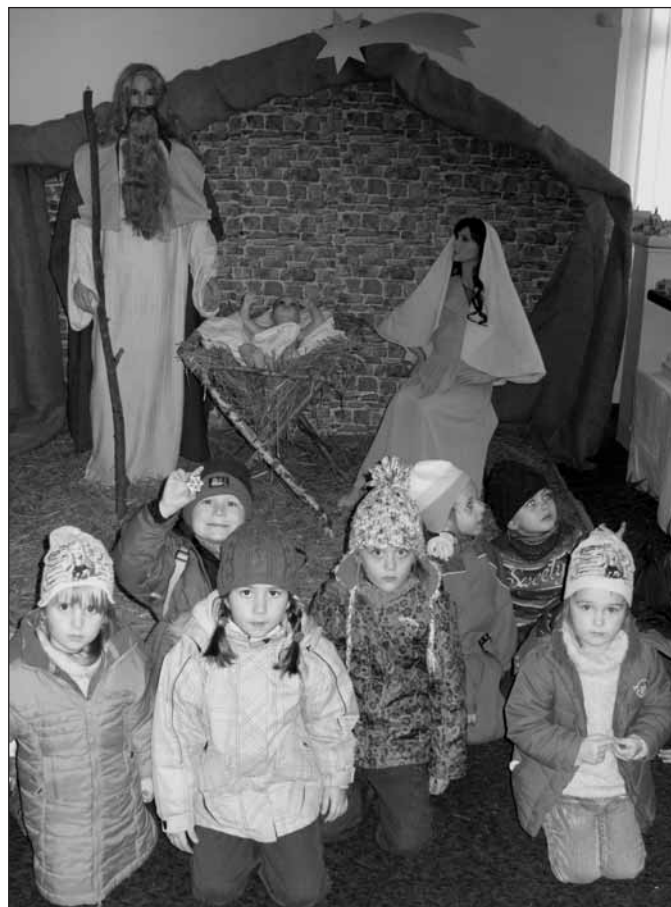
Dne 14. prosince jsme se vydali do Mariánské Týnice zdobit perníčky a prožít si staročeské Vánoce. Text a foto Kateřina Pražáková