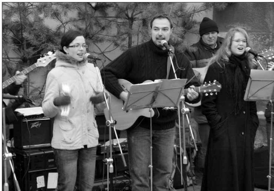
Muzikanti doprovodili představení Živý betlém vánočními písněmi a koledami. (Více na str. 13)

Naší opětovné žádosti o poskytnutí finančních prostředků na výstavbu komunikací ve výše jmenovaných ulicích, nebylo opět vyhověno, stejně jako u nové žádosti na výstavbu sportovní haly. Na obě tyto stavby bude možno opět žádat o dotaci na základě výzvy, která bude vyhlášena v únoru 2010. Proto připravujeme podklady pro opakované podání žádosti. Na vysvětlenou bych rád upozornil na skutečnost, že každá podávaná žádost o dotaci musí být doložena takzvaným finančním zdravím žadatele, tj. dokladem schopnosti města povinného