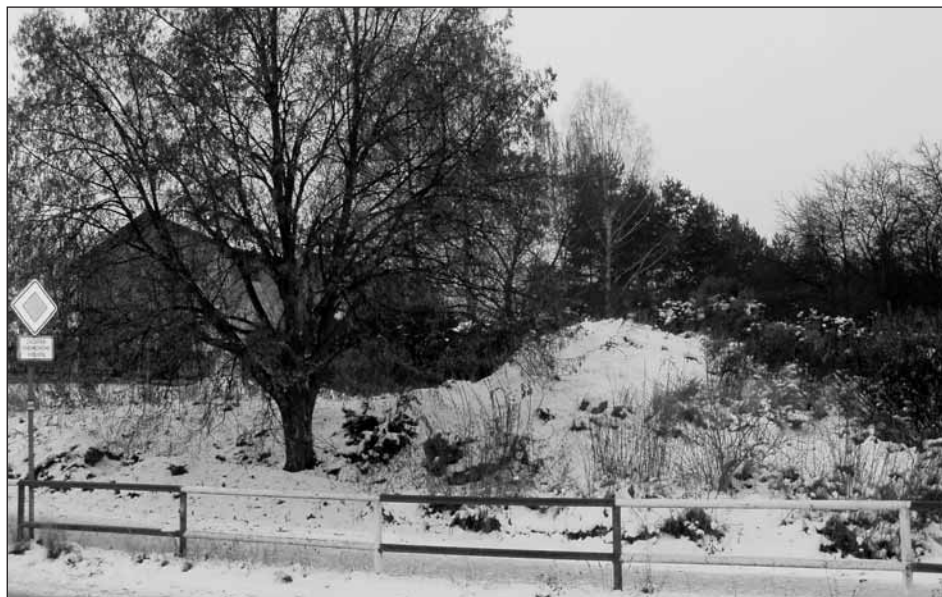
Skládka na soukromém pozemku nad železničním přejezdem na rohu Radyňské a Riegrový ulice.

pověst, je skládka na pozemku přiléhající k trati a závorám Českých drah v Radyňské ulici. Jde o skutečně bolavé místo uprostřed města. Chodí kolem něho stovky návštěvníků a turistů směřujících na Radyni, denně obyvatelé z Vilové Čtvrti a děti navštěvující ZŠ. Vidí to cestující vlaky, jen ne majitelka zmiňovaného soukromého pozemku. Nejméně několik let je tato skládka u „lípy republiky“ předmětem kritiky a jednání orgánů města, odborů výstavby, životního prostředí i funkcionářů. Zatím vše marné. Majitelka má své záměry a město nemá do nich co mluvit.