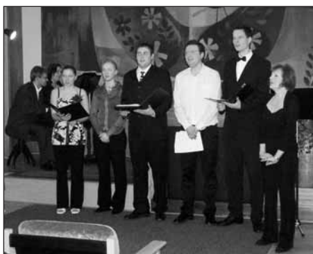
Snímek se vracíme k vánočnímu koncertu.

Nejen vánočními písněmi a koledami se 15. prosince v podvečer rozezněla obřadní síň staroplzenecké radnice. Návštěvníci koncertu si mohli v klidu vychutnat nejen příjemné vystoupení studentů Konzervatoře Plzeň, ale i šálek svařeného vína, který byl pro ně připraven.