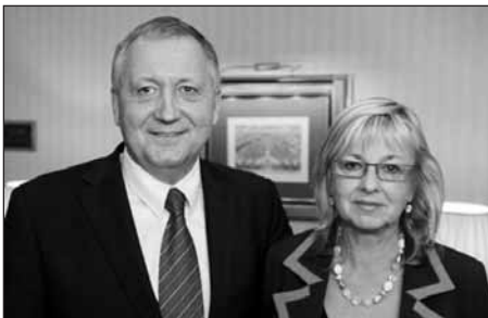
Majitelé firmy po prezentaci před porotou.

kteřá mluví barvami. Nechává múzy, aby vedly jeho ruku.