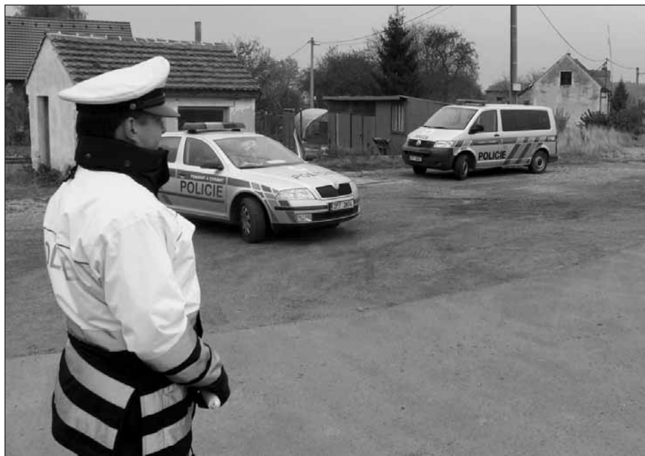
Nejvýznamnější prioritou této skupiny je stíhat neukázněné řidiče, kteří jsou svým jednáním nebezpeční svému okolí, především svojí bezohlednou rychlou jízdou.

Nejvýznamnější prioritou této skupiny je stíhat neukázněné řidiče, kteří jsou svým jednáním nebezpeční svému okolí především svojí bezohlednou rychlou jízdou v rizikových místech, zvláště v obcích. Pomocí moderní techniky jako je například tester na návykové látky, digitální alkotester, či laserový radar v kombinaci s novými rychlými vozidly se dohledové skupině daří takové řidiče eliminovat a tvrdě trestat. Často se také můžeme setkat se součinností s hlídkami obvodních