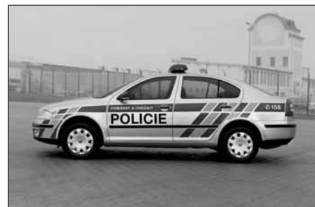
Také na jižním Plzeňsku jsou policejní útvary postupně vybavované novými služebními vozy značky Škoda Octavia, které nahradí dosluhující Felicie a Fabie.