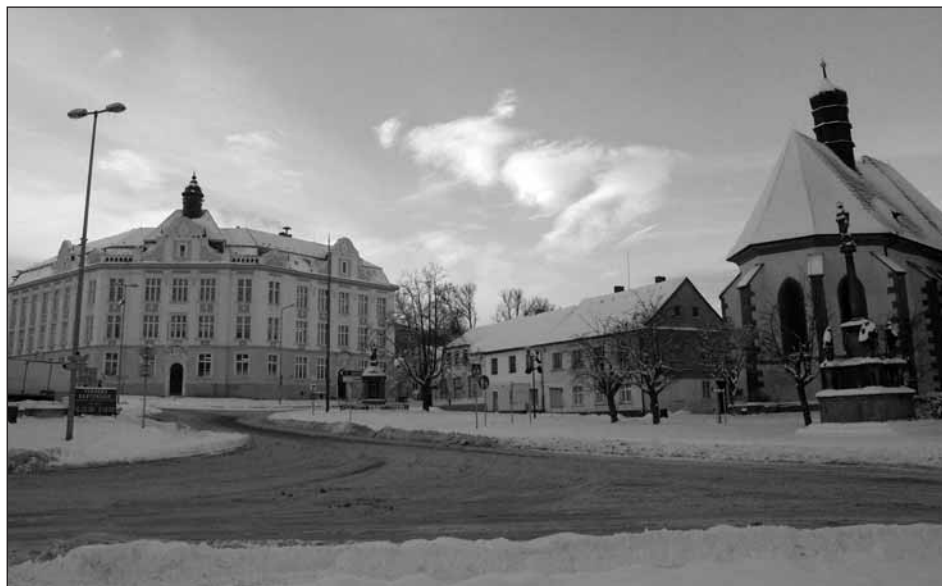
Sněhová nadílka navodila v městečku slavnostní vánoční atmosféru.

Vážení spoluobčané, ve výše uvedeném uvádím pouze důležité a podstatné skutečnosti, protože bych nerad, aby můj úvod-