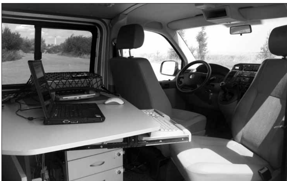
Moderně vybavená mobilní kancelář umístěná ve služebním vozidle Volkswagen Transporter ulehčuje policistům práci během vyšetřování dopravní nehody v terénu.