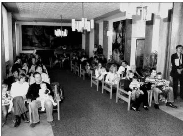
Snímek se vracíme k listopadovému slavnostnímu vítání občánků města Starý Plzenec.