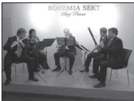
Soubor Afflatus Quintet se představil v BOHEMIA SEKT Centru.

V úterý 8.11.2011 se uskutečnil v BOHEMIA SEKT Centru v pořadí 2. koncert 27. koncertní sezóny Kruhu přátel hudby ve Starém Plzenci. V tomto hudebním podvečeru se představil komorní soubor Afflatus Quintet. V programu zazněly skladby našich i světových skladatelů.