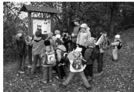
U zastávky naučné stezky s názvem Lopatárna.