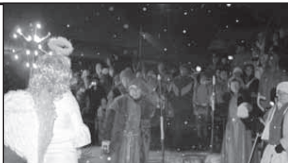
Loňské představení betlémského příběhu.