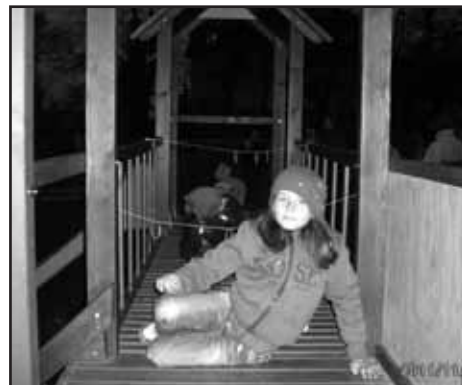
Viktorka ze sedlecké školky při překonávání překážek

na Vánoční besídku žáků MŠ, která se koná 13.12.2011 od 16.30 hodin v tělocvičně školy, a na Vánoční trhy a zpívání u stromečku žáků ZŠ, které se konají 14.12.2011 od 16.00 hodin též v tělocvičně školy.