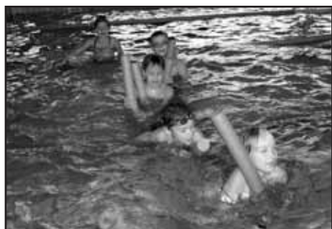
Jede jede mašinka....

V úterý 25. 10. navštívila celá naše škola plzeňskou ZOO. Počasí nám celkem přálo. Přes mlžný opar od rána svítilo sluníčko, a tak jsme nemrzli ani my, a viděli snad