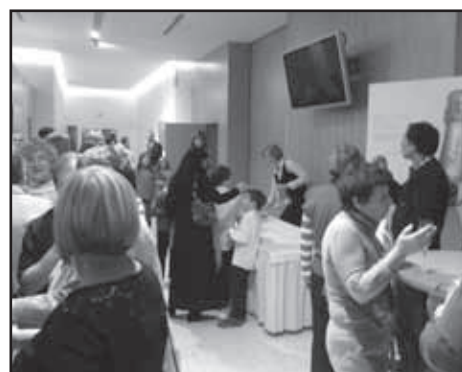
O přestávce proběhla degustace perlivých vín, kterou pro návštěvníky koncertu připravila společnost BOHEMIA SEKT.

Současné období přináší ansámblu (kromě trvalého návratu hornisty Radka Baboráka od Berlínských filharmonií) mnoho dalších plánů a projektů. Mezi nej-