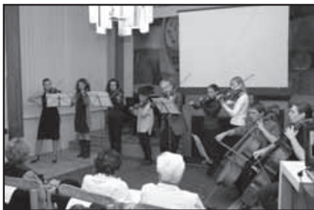
Příjemnou atmosféru navodil svým koncertem komorní soubor Základní umělecké školy Starý Plzeňec.