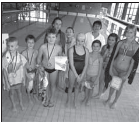
Účastníci plaveckých závodů ze ZŠ Starý Plzenec.

Naše školní zahrada má velký prostor, kde si děti hrají na jaře, v zimě a na podzim - baví je hry na pískovišti i hřišti. Cvičí se švihadly, hrají hry s míčem. Nejvíce si užijí prolézaček. Před několika dny měly děti hezký zážitek z pouštění draků. Užily si „Drakiády“. Šimonovi vylétl drak nejvýše. Bylo mnoho legrace i trochu slziček, když drak nechtěl poslouchat. Odpoledne se dětem líbilo, a proto druhý den pokračo-