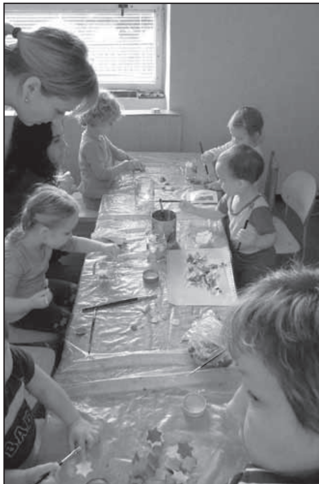
Děti vyrábí lampiónky na Svatomartinský pochod.