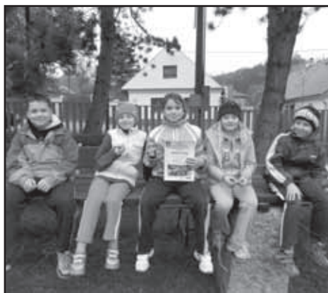
Vítězné družstvo mladší kategorie.