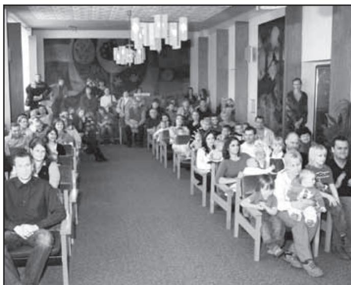
Město Starý Plzenec přivítalo nové občáňky.

Po slavnostním obřadu se mohli rodiče se svými dětmi nechat vyfotografovat pro-