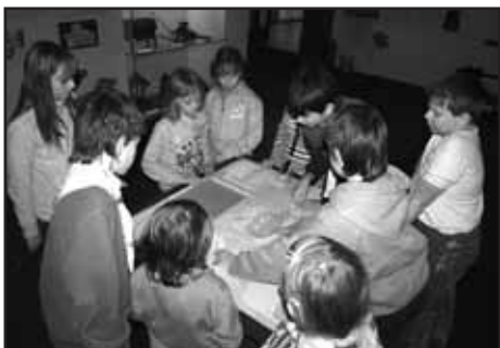
Děti zkoumají postup výroby piva.

V sobotu 22. 10. vedly naše kroky po nově otevřené naučné stezce Údolím Úslavy. Spíše než kroky bych však měla říci tempa, nebyli jsme totiž pouhými turisty, nýbrž "řekoplavci". K prvnímu zastavení NS, kterým je kostel sv. Jiří v Plzni Doubravce, jsme se přiblížili vlakem, poté už jsme se "plavili" s různorodým vybavením (plavecké brýle, kruh atp.) přes Lopatárnu, Letnou, Lobzy a Božkov až na Koterovskou náves. Pro plavbu ranní mlhou jsme volili střídavě kraul, znak a prsa,