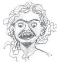
Hanuš