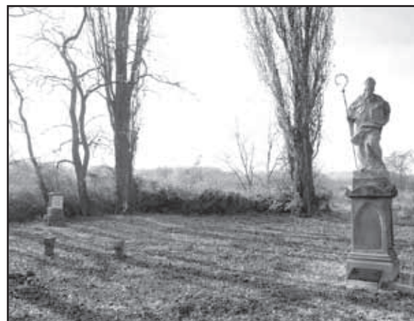
Místo bývalého kostela svatého Blažeje se nachází v topolovém háji na okraji Starého Plzence jihozápadním směrem v blízkosti železniční trati.