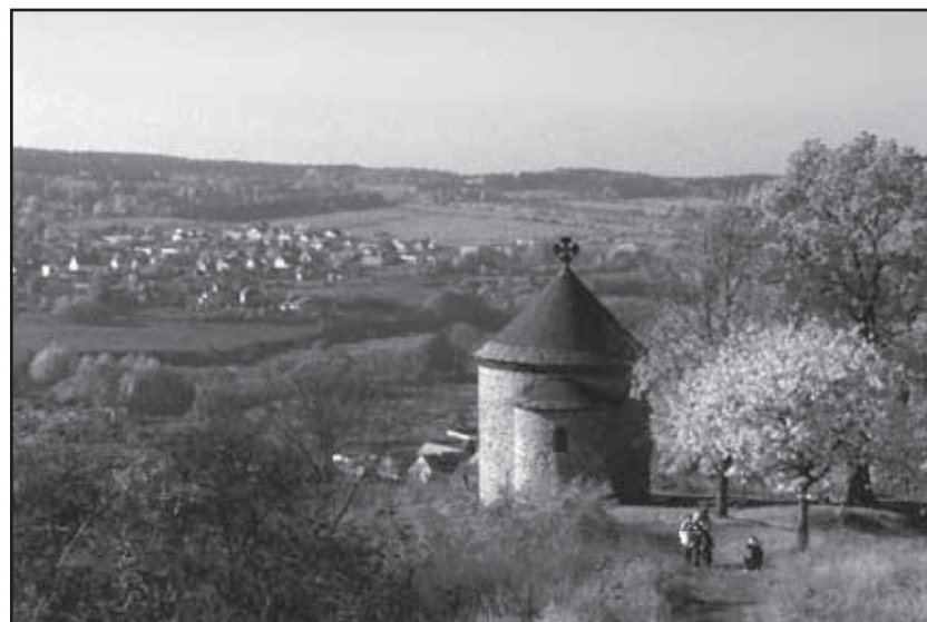
Pohled z Hůrky na Starý Plzeňec