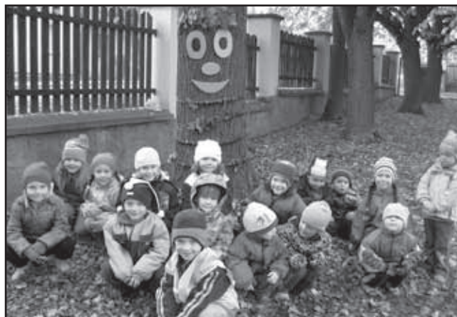
Děti z Mateřské školy v Sedlci u stromu Podzimníčku.