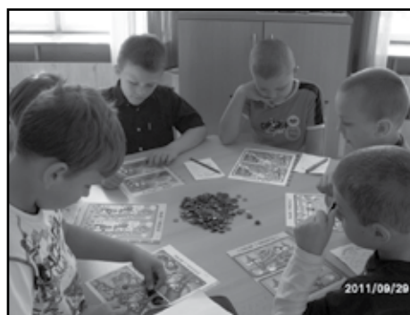
Mozkovna - hledání rozdílů.