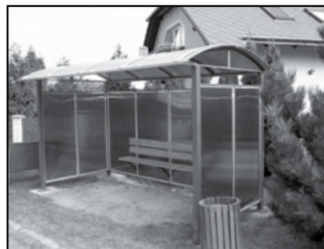
Jedna z obnovených autobusových čekáren na konečné zastávce MHD č.51 v Radyňské ulici.

Vážení občané, konkrétně ve Starém Plzenci byly obnoveny autobusové zastávky v celkové hodnotě 152.880 Kč včetně DPH se spoluúčastí města ve výši 44.590 Kč včetně