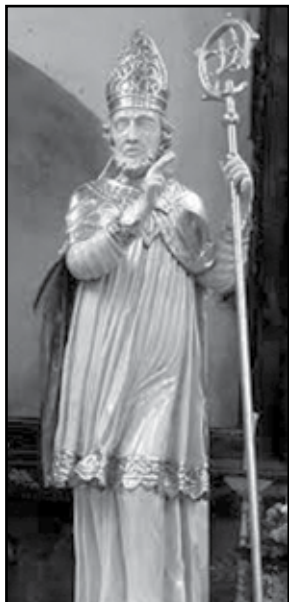
Socha sv. Vojtěcha v kapliče ve Vrčeni.

„Po vykonané cestě přišli k Plzni, kteréž město leží na hranici oné země. Zarmoutilo svatého muže hrozná podívání: neboť vida, kterak je tu odbýván trh, promluvil takto: „Ejhle, toť vaše víra, takový jest váš slib. Takto máte světití den tak posvát-