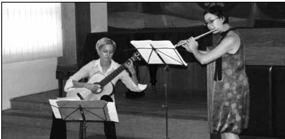
Komorní soubor spojující zvuk flétny a kytary Duo aMUSED zahájil novou koncertní sezónu.