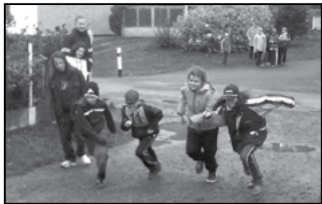
Soutěž v Oplotě.