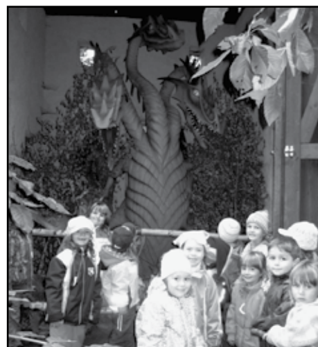
Děti s drakem.