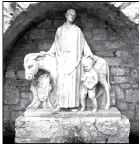
Socha Bruna z Querfurtu zdobí kašnu v jeho rodném městě.

ný, kterého Kristus vstal z mrtvých a zvítězil nad smrtí. Mínete, že s mou důstojností se to srovnává, abyste mne klamali? Věřte, nikoli mne, ale boha sama klamete. To říka, odehnal všechny, kteří byli na trhu.“ (Životy svatých a jiných osob nábožných)