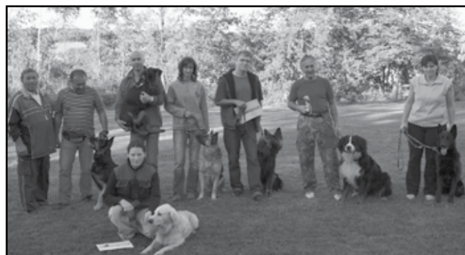
Naše družstvo. kategorii obdrželi pohár, krmení pro psa a výcvikové pomůcky, všichni účastníci diplom.