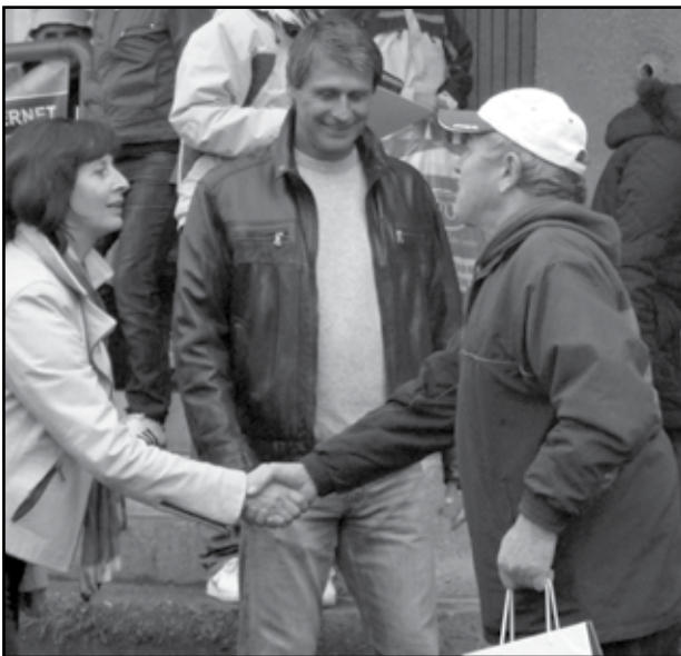
Starostka města Vlasta Doláková spolu s rekordmanem Janem Železným blahopřeje nejstaršímu účastníkovi letošního ročníku soutěže v hodu oštěpem.

Jak už ve Starém Plzenci na podzim bývá pravidlem, na hřišti kopané se vše změnilo k tomu, aby zde mohly proběhnout naše závody v hodu oštěpem amatérů. Nalajnuje se rádná výseč, upraví se rozběžiště, které v letošním roce poprvé kryl tartan, získaný z rekonstruovaného stadionu ve Štruncových sadech v Plzni. V letošním roce to bylo o to pikantnější, že se jednalo o již desátý - jubilejní - ročník, a tak se na mysl vkrádaly úžasné vzpomínky na prvotní sázku v klubovně, na první rekord Filipa Jichy, na první návštěvu Jana Železného, návštěvu Bány Špotákové a vlastně na všechny hezké věci, které se za těch devět předchozích ročníků udály. A věřte, že je jich opravdu dlouhá řádka.