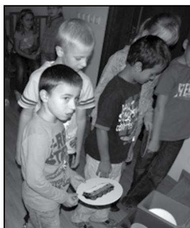
Žáci 2.B se učí třídít odpad.