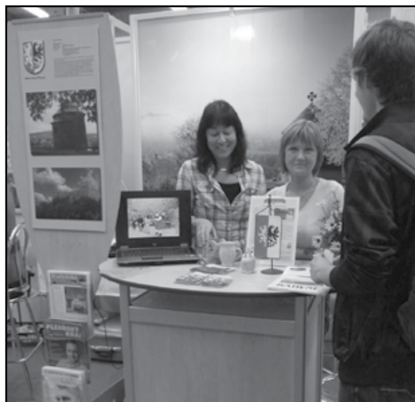
Stejně jako v předchozích letech se na veletrhu ITEP 2011 prezentovalo i město Starý Plzeňec.

U výstavního stánku města Starého Plzence byl největší zájem o hrad Radyni a národní kulturní památku Hůrku s rotundou sv. Petra a Pavla. Návštěvníci si domů odnášeli kromě propagačních materiálů, map a oblíbených kapesních kalendářků také spoustu nových informací o zajímavých místech u nás i v zahraničí.