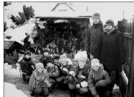
U betléma v Příchovicích.

koulování, proto se nakonec všichni těšili do vyhřátých domovů.