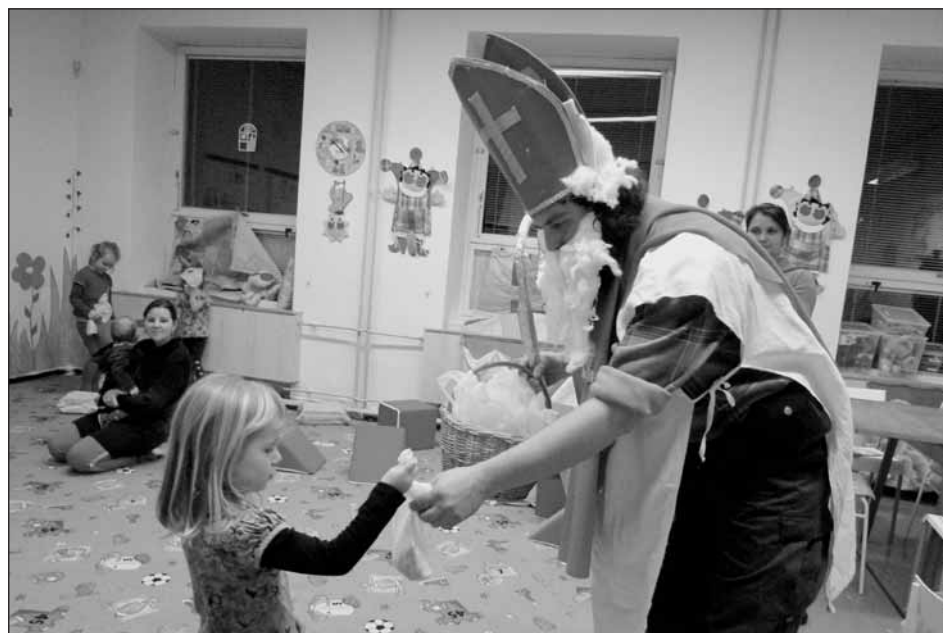
Mikulášská nadílka v Rodinném centru Dráček.