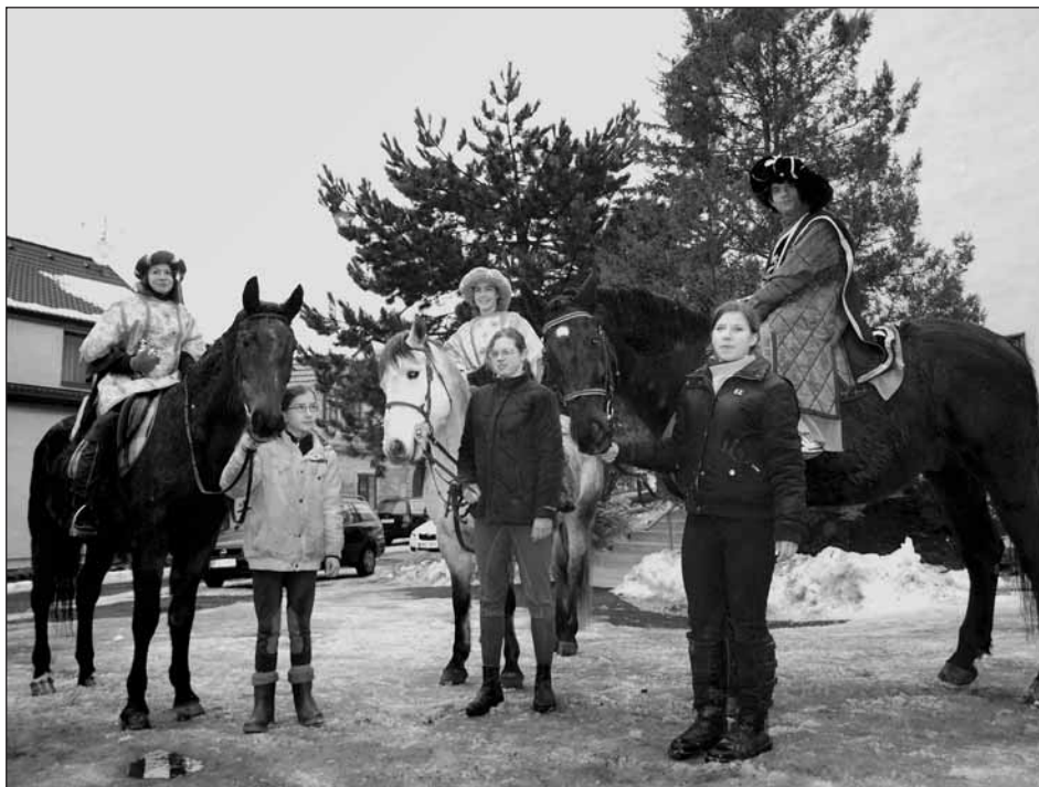
Navzdory nepříznivému počasí se i letos Živý betlém vydařil. Na snímku jsou Tři králové na cestě k narozenému Jezulátku.

dložení vodovodního řádu v ulici Podhradní stejně jako zrealizován vodárenský vrt pro zásobování místního hřbitova užitkovou vodou. Celé toto dílo pracuje automaticky a i v letních měsících nebylo dne, aby na hřbitově nebylo dostatek vody.