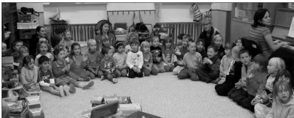
Zpívání vánočních koled během vánoční nadílky.