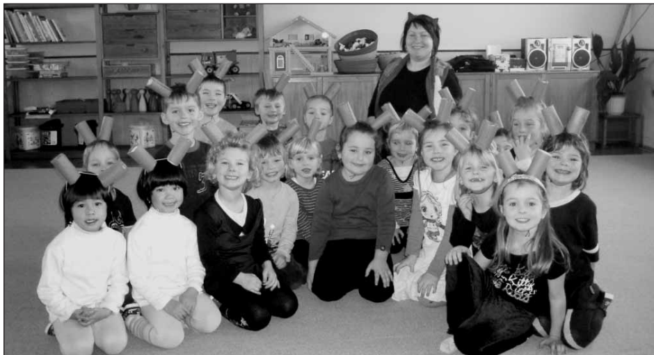
Návštěva čerta a Mikuláše ve 4. třídě.