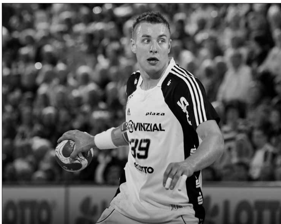
Házenkář Filip Jícha se umístil v anketě Sportovec roku České republiky 2010 na skvělém šestém místě.